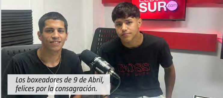
Los boxeadores de 9 de Abril, felices por la consagración.