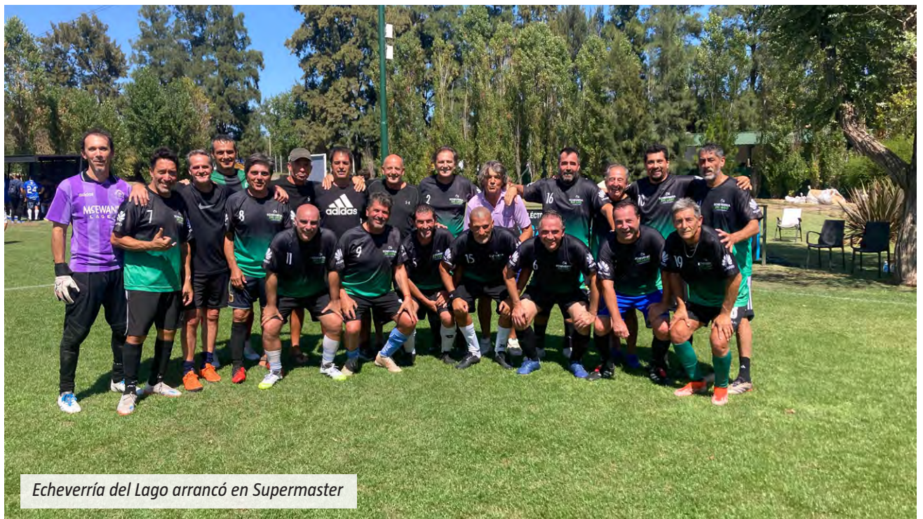
Echeverría del Lago arrancó en Supermaster

partidos previos, y el duelo ante Saint Thomas Oeste fue el tercero desde su vuelta. “Este es el tercer partido que estamos jugando, nos estamos conociendo. Si bien somos muchos del barrio, hay gente nueva para hacer el equipo más competitivo”, explicó, en referencia a la