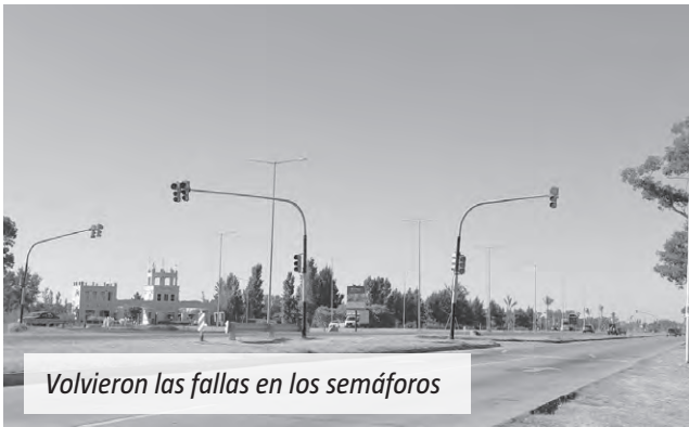
Volvieron las fallas en los semáforos

El cruce es utilizado habitualmente por vecinos de los barrios Santa Rita y San Lucas, quienes lo emplean para retomar mano hacia Canning, así como también por quienes se dirigen hacia el centro