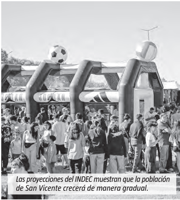
Las proyecciones del INDEC muestran que la población de San Vicente crecerá de manera gradual.

En San Vicente la proyección muestra un crecimiento poblacional cercano al 3% para 2035. La población pasaría de 98.977 habitantes en 2022 a 102.009 en 2035, lo que equivale a unas 3.032 personas más en el período. En la estimación por sexo, se indica que hacia 2035 habría 49.649 mujeres y 52.360 varones. El crecimiento sería gradual: 99.868 habitantes en 2026 y 101.627 en 2034.