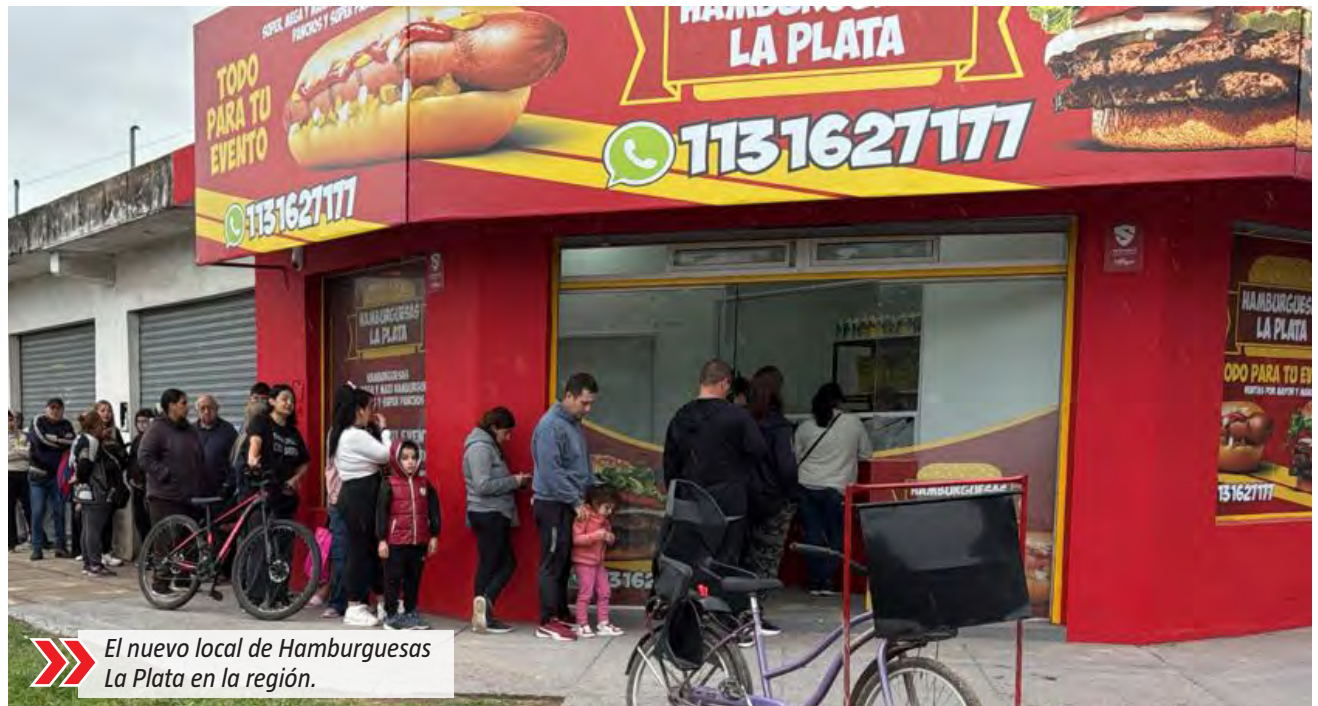
El nuevo local de Hamburguesas La Plata en la región.