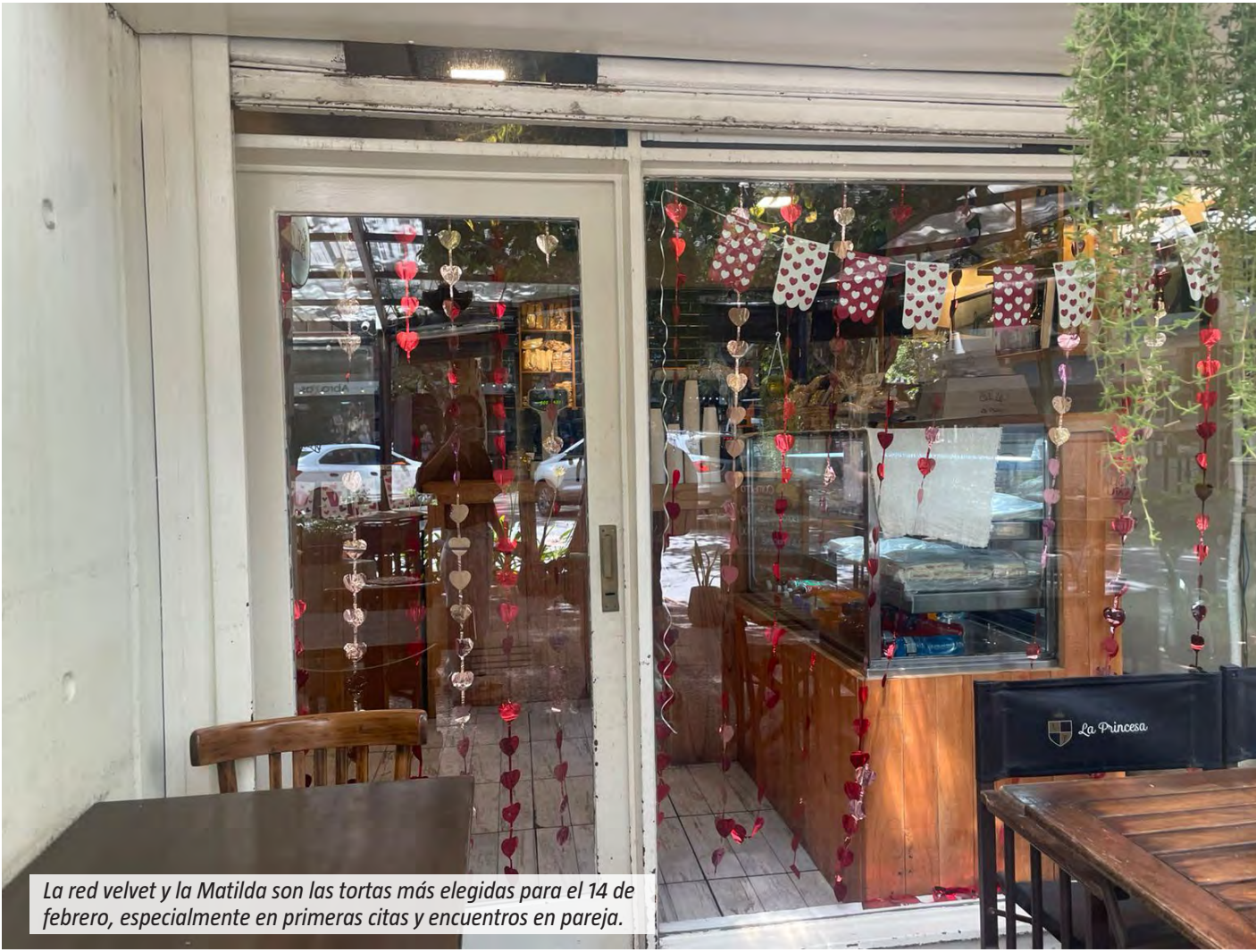
La red velvet y la Matilda son las tortas más elegidas para el 14 de febrero, especialmente en primeras citas y encuentros en pareja.

Los bares y cafeterías de Monte Grande reciben una jornada con expectativas. Si bien no suelen trabajar con reservas, tienen pedidos especiales de tortas, medialunas y sándwiches de miga. “Vienen muchos adolescentes a las mesitas”, cuentan desde uno de los locales. Las primeras citas son moneda corriente y, aseguran, los nervios se notan. “Más o menos, están más nerviosos que sueltos”, describen entre risas. El clima, sin embargo, es distendido. “Acá sale todo bien”, aseguran. En las cafeterías también aseguran que, además de los pedidos tradicionales, hay tortas que se repiten cada 14 de febrero. Entre las más elegidas mencionan la red velvet y la Matilda, asociadas a la estética y al clima romántico de la fecha. Son opciones que suelen acompañar las primeras citas o celebraciones en pareja.