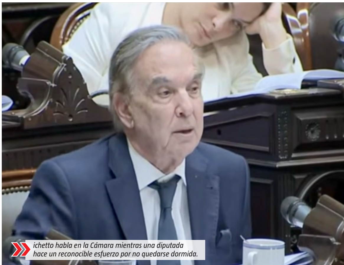
Pichetto habla en la Cámara mientras una diputada hace un reconocible esfuerzo por no quedarse dormida.

"Se ha votado el presupuesto nacional la inversión en educación primaria, en educación secundaria, en elementos de contención, en fondos de la universidad, y todo ha ido a la baja en el presupuesto 2026", continuó exponiendo Pichetto, para después explicar el fondo real del debate. "Estas son medidas de efecto que sirven para el lucimiento de determinados senadores o ex ministras, que ahora parece que tampoco están conformes con 14, quieren bajar a 13, a 12 o a 10, porque eso las ubica más a la derecha y las pone en un lugar donde el facilismo discursivo satisface a algunos sectores", desafió Pichetto, para luego reconocer: "Por supuesto que siempre un hecho de inseguridad, una muerte de un inocente, o un crimen que se produce, nunca se va a poder justificar el dolor de la familia de esa persona que murió. Siempre es importante el hecho, pero mucho más cuando se reproduce mediáticamente con un