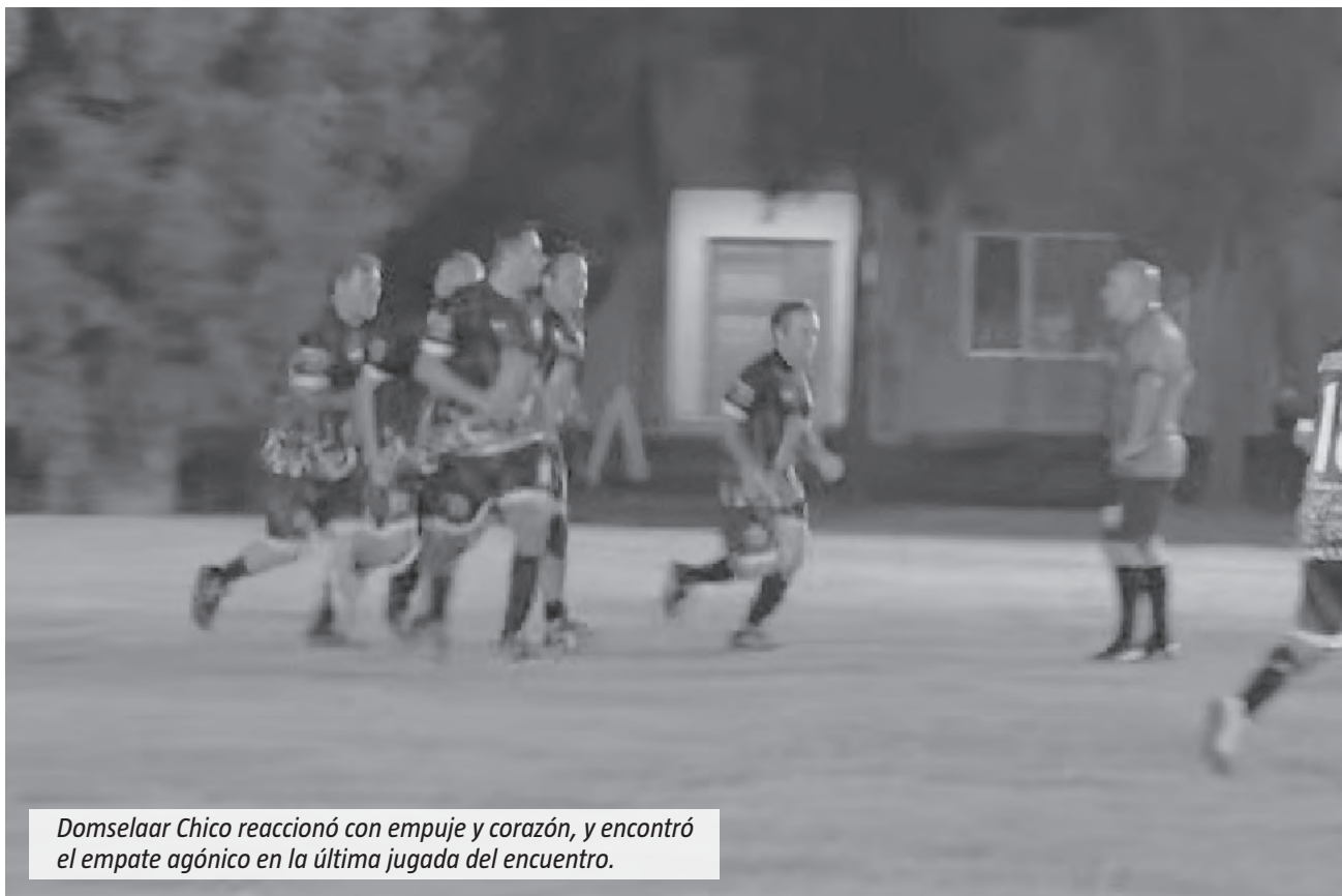
Domselaar Chico reaccionó con empuje y corazón, y encontró el empate agónico en la última jugada del encuentro.

gusto a triunfo por la forma en que se dio; para El Principado, la frustración de haber dejado escapar una ventaja de tres goles. Con ocho equipos todavía