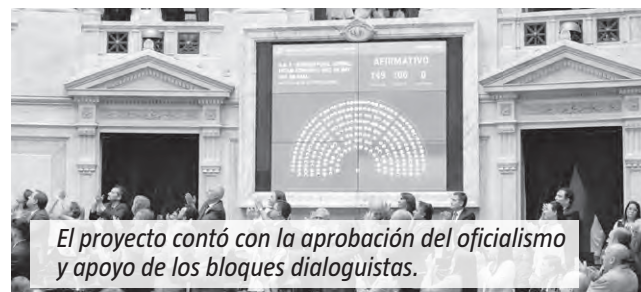
El proyecto contó con la aprobación del oficialismo y apoyo de los bloques dialoguistas.

La norma establece una pena máxima de 15 años para homicidios, robos violentos, abusos sexuales y secuestros. En casos con condenas menores a 10 años, prevé alternativas como servicios comunitarios, monitoreo electrónico, prohibición de acercamiento a la víctima y reparación integral del daño, entre otras medidas.