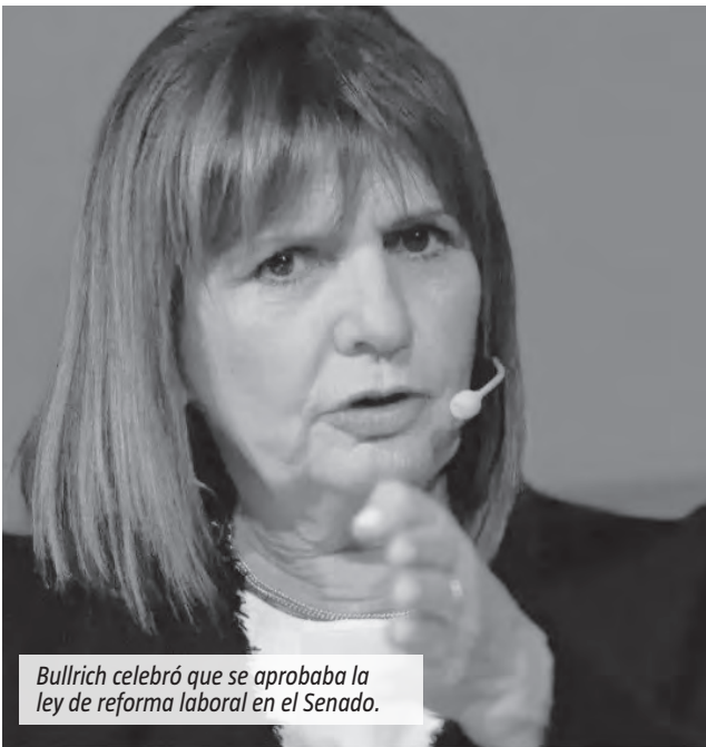
Bullrich celebró que se aprobaba la ley de reforma laboral en el Senado.

En declaraciones a A24, recalcó: “Es histórico que 42 senadores hayan votado una reforma laboral, que da tantas certezas, que termina con tantos problemas que hemos tenido, deformación total del mundo del trabajo, conflictividad permanente”.