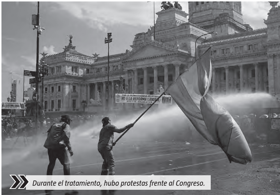
Durante el tratamiento, hubo protestas frente al Congreso.

Uno de los capítulos centrales se refiere al régimen de vacaciones. El texto habilita esquemas más flexibles para el otorgamiento de la licencia anual, permitiendo que empleadores y trabajadores acuerden su fraccionamiento en distintos períodos del año, siempre bajo determinadas condiciones. La iniciativa introduce así un criterio más adaptable en la organización de los descansos. En materia de desvinculaciones, el proyecto incorpora alternativas al sistema tradicional de indemnización por despido.