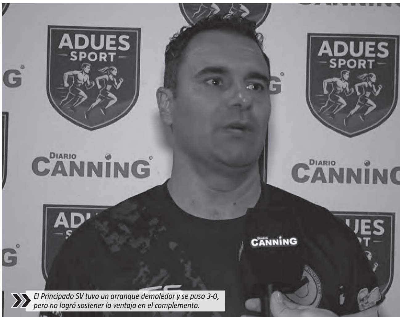
➤ El Principado SV tuvo un arranque demoledor y se puso 3-0, pero no logró sostener la ventaja en el complemento.

“Fue un poquito más de huevo que otra cosa porque fútbol ya no había. Era más pelotazo que otra cosa, estábamos cansados, el fútbol lo pusimos el primer tiempo donde lo podríamos haber ganado y no lo pudimos meter que tuvimos la situación más clara”, señaló uno de los protagonistas de Domselaar Chico, reflejando el esfuerzo y la entrega de un equipo que nunca bajó los brazos. El empate dejó sensaciones encontradas: para Domselaar, un punto con