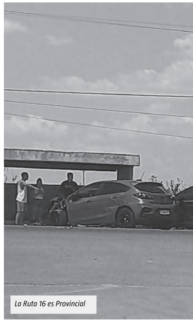
La Ruta 16 es Provincial