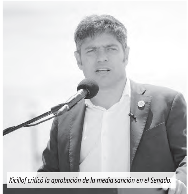
Kicillof criticó la aprobación de la media sanción en el Senado.

“Llamar modernización a esto es una burla porque lo que se busca no es mejorar a los que están por abajo” de la pirámide social, sin poder acceder a sus derechos laborales, “sino bajar a los que están por arriba, quitándoles beneficios”, explicó en declaraciones a El Destape.