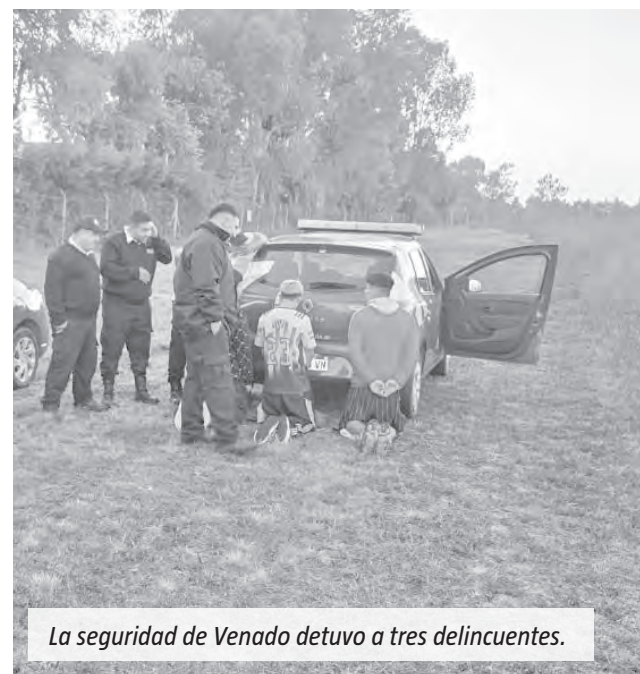
La seguridad de Venado detuvo a tres delincuentes.

presa de seguridad, lo que permitió cerrar la zona y localizar a los sospechosos. Los tres masculinos fueron encontrados en las inmediaciones de los dos countrys, cerca del nuevo barrio Bell Barri, según la información aportada. Y se los retuvo hasta la llegada de la policía