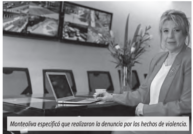
Monteoliva especificó que realizaron la denuncia por los hechos de violencia.

La ministra de Seguridad, Alejandra Monteoliva, se refirió a los incidentes que ocurrieron durante el debate del proyecto de ley de la reforma laboral en el Senado y aseguró que ya se formalizó una denuncia contra grupos con “características violentas”.