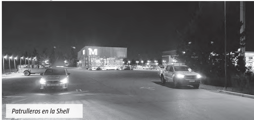
Patrulleros en la Shell

Tras la reaparición de picadas clandestinas sobre la Ruta Provincial 58, este fin de semana se pudo ver un operativo preventivo de seguridad durante la noche del sábado 7 de febrero en Canning, dispuesto por las autoridades de Presidente Perón. El despliegue incluyó la presencia de móviles policiales en la estación de servicio Shell situada en la rotonda que conecta las rutas 16 y