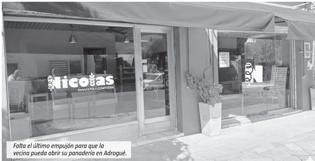
Falta el último empujón para que la vecina pueda abrir su panadería en Adrogué.