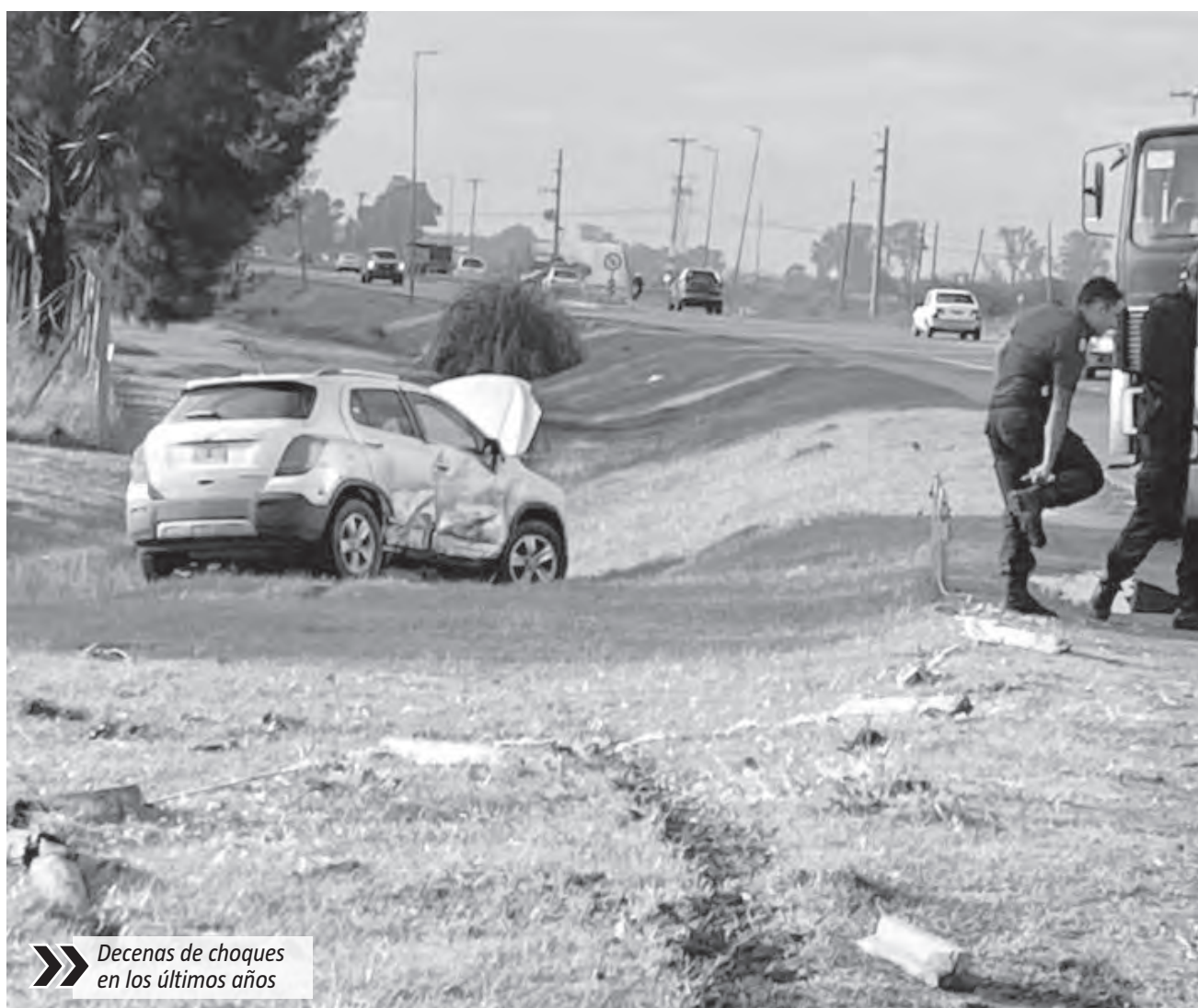
Decenas de choques en los últimos años

A la problemática estructural se suma la falta total de iluminación en el sector. Durante la noche la visibilidad es práctica-