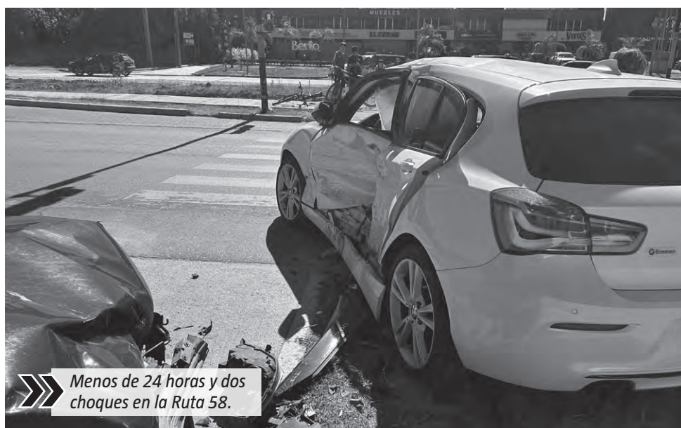
Menos de 24 horas y dos choques en la Ruta 58.

De acuerdo a los datos obtenidos en el lugar, todo indica que en el Peugeot viajaban dos jóvenes, mientras que en el BMW circulaba una pareja, que salían de jugar un amistoso con Saint Thomas Oeste. Un testigo aseguró que fue "imposible que pasaran en verde porque yo pasé segundos antes que cortara", en conversación con El Diario Sur.