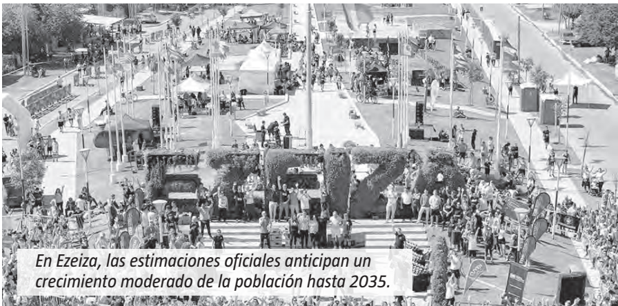
En Ezeiza, las estimaciones oficiales anticipan un crecimiento moderado de la población hasta 2035.

La proyección para Ezeiza también indica un crecimiento moderado. La población de este distrito pasaría de 200.500 habitantes en 2022 a 203.364 en 2035, lo que implica un aumento de 1,4% (aproximadamente 2.864 personas más). Según la estimación oficial, habría 100.414 mujeres y 102.950 varones hacia 2035. El crecimiento por año es paulatino, con proyecciones intermedias que rondan los 201.465 en 2026 y más de 203.000 hacia 2034.