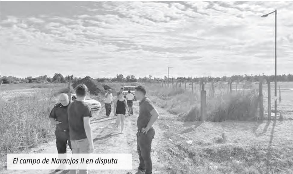
El campo de Naranjos II en disputa

La Fiscalía N°4 investiga una disputa por la propiedad de un campo donde se desarrolla el barrio privado Naranjos II, de Canning. En el conflicto estarían involucrados la empresa desarrolladora Solfrapi y un hombre de nacionalidad uruguaya, quienes reclaman la titularidad del predio.