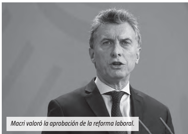
Macri valoró la aprobación de la reforma laboral.

En un nuevo guiño de apoyo al Gobierno, el expresidente Mauricio Macri valoró la aprobación del Senado al proyecto de ley de la reforma laboral y consideró que era “un paso adelante en la dirección correcta”.