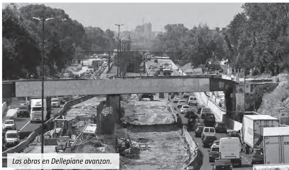
Las obras en Dellepiane avanzan.

de las principales conexiones entre el sur del conurbano y la Ciudad de Buenos Aires. Además, se vio una sobrecarga vehicular en la avenida General Paz por los desvíos y restricciones implementadas. Según se informó, las tareas fueron parte de un plan de mejoramiento integral sobre la traza de la autopista. Los cortes y reducciones afectaron especialmente a quienes circulan desde la autopista Riccheri y buscan ingresar a Capital Federal.