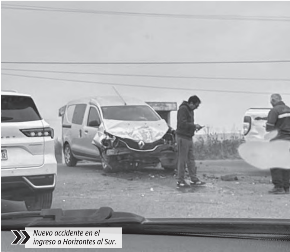
Nuevo accidente en el ingreso a Horizontes al Sur.

Este miércoles por la mañana se produjo un nuevo accidente de tránsito sobre la Ruta 16, en el ingreso al barrio cerrado Horizontes al Sur. Vecinos reclaman medidas de seguridad vial desde hace años.