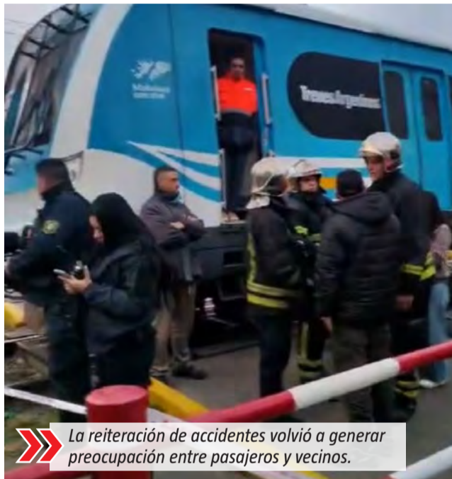
La reiteración de accidentes volvió a generar preocupación entre pasajeros y vecinos.

La seguidilla de situaciones se extendió además a Monte Grande. Allí, un joven de aproximadamente 20 años fue arrollado por una formación en el paso a nivel de las calles Rodríguez y Mariano Alegre el jueves 21 de mayo. De acuerdo a testimonios recabados por El Diario Sur, el joven se habría arrojado hacia las vías al paso del tren. Vecinos aseguraron que la formación logró frenar a tiempo y la víctima