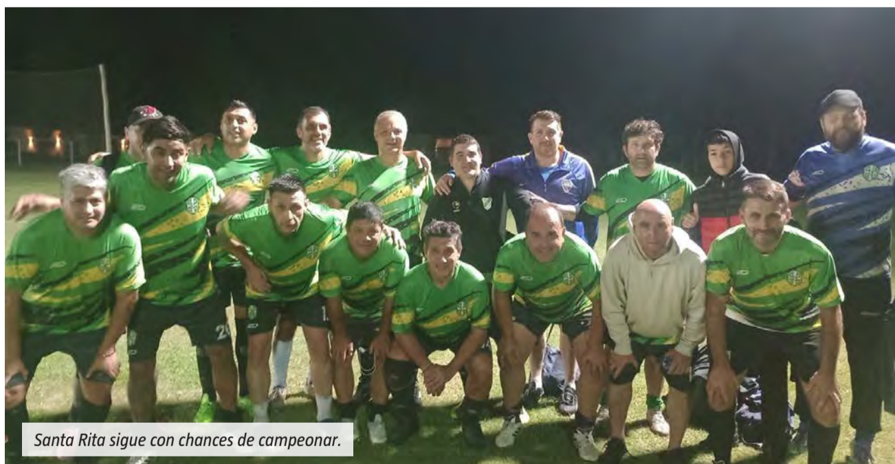
Santa Rita sigue con chances de campeón.