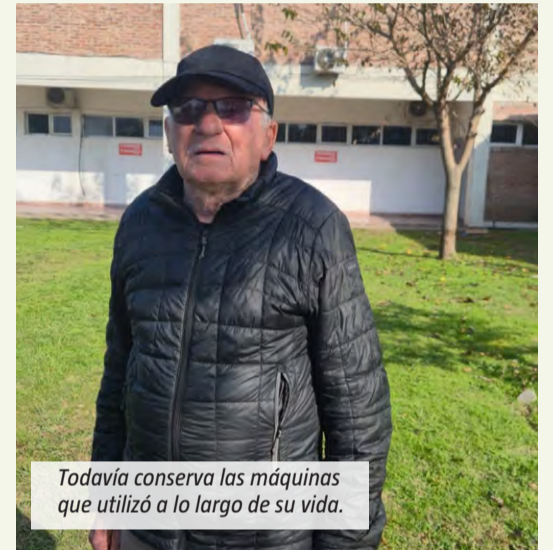
Todavía conserva las máquinas que utilizó a lo largo de su vida.

Sin embargo, el deporte no fue el único eje de su vida. "Toti" trabajó como carpintero hasta los 91 años y todavía conserva las máquinas que utilizó durante décadas para realizar diferentes trabajos. De acuerdo a lo que expresó, construyó una vida atravesada entre herramientas, maderas y entrenamientos: "Nunca paré".