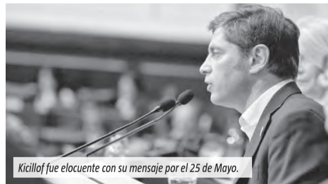
Kicillof fue elocuente con su mensaje por el 25 de Mayo.

Tras fustigar las políticas sociales y económicas implementadas por la gestión anarcocapitalista, el gobernador bonaerense, Axel Kicillof, aseguró que "tenemos la obligación de mantener vivo el amor por la Patria" y "lo peor que podemos hacer es entregarla".