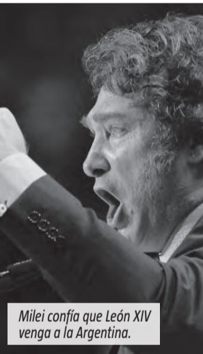
Milei confía que León XIV venga a la Argentina.

La posible llegada del Papa aparece además como un gesto político relevante para el Gobierno, que busca recomponer vínculos