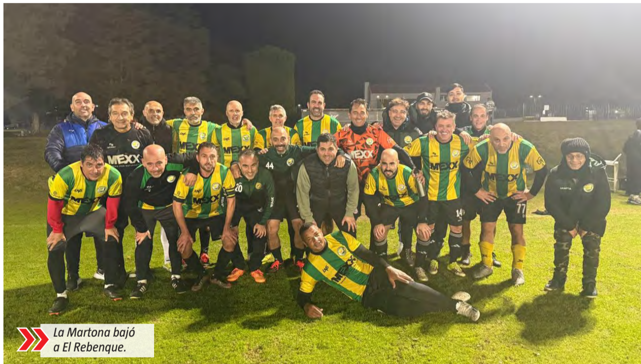
La Martona bajó a El Rebenque.

La última fecha se jugará el miércoles 3 de junio. Santa Rita enfrentará a Santa Juana y dependerá de sí mismo para ser campeón. El Rebenque jugará ante Horizontes al Sur y necesitará sumar más puntos que Santa Rita o igualar su resultado esperando una diferencia de gol favorable. Por su parte, La Martona deberá vencer a El Principado San Vicente y aguardar que ninguno de los dos líderes gane.