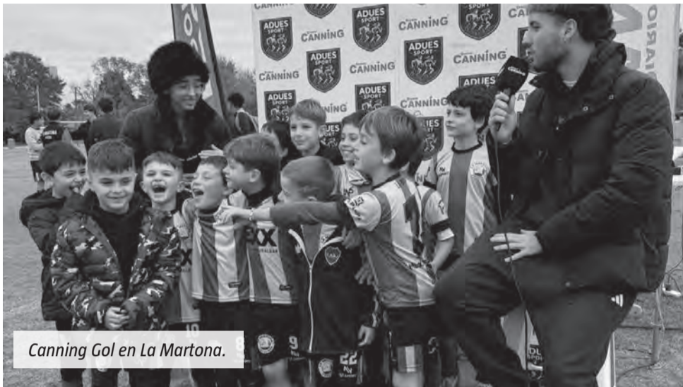
Canning Gol en La Martona.

El programa transmitió la fecha entre La Martona y Don Joaquín. Hubo una contundente victoria en Sexta, un triunfo local en Séptima y un partidazo en Octava que se definió sobre el final.