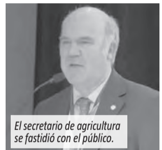
El secretario de agricultura se fastidió con el público.

El secretario de Agricultura, Ganadería y Pesca de la Nación, Sergio Iraeta, protagonizó una particular intervención durante su exposición en la conferencia Maizar, un encuentro que reunió a referentes del sector agropecuario en la Ciudad de Buenos Aires. El discurso del funcionario evidenció ciertas diferencias de expectativas entre los productores y la búsqueda de reconocimiento por parte del Gobierno ante las recientes medidas anunciadas para la agroindustria. El funcionario remarcó que el Gobierno nacional implementó una reducción en el esquema de retenciones pocos días antes del evento, pero cuestionó la escasa reacción del público ante la novedad. "Bajaste la retención hace tres días y, y es como si nada, como si no hubieras hecho nada", sostuvo ante