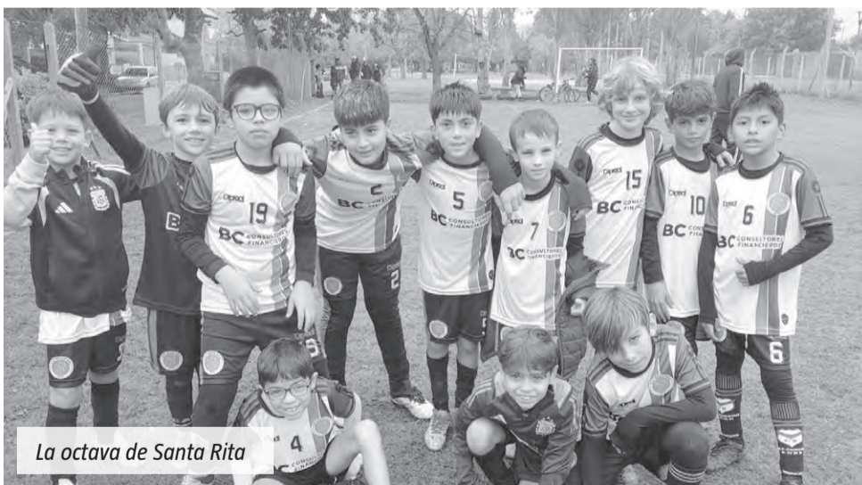
La octava de Santa Rita