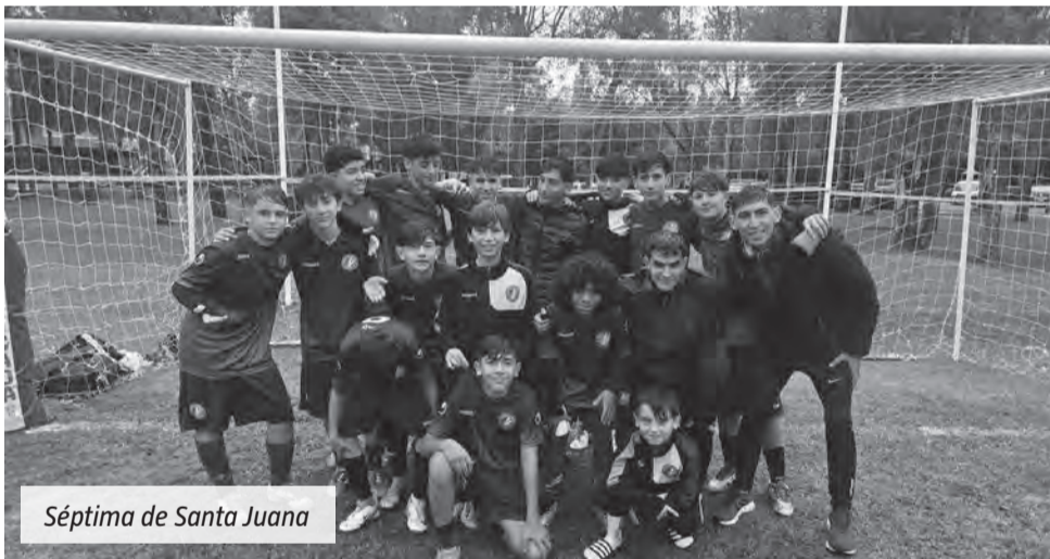
Séptima de Santa Juana