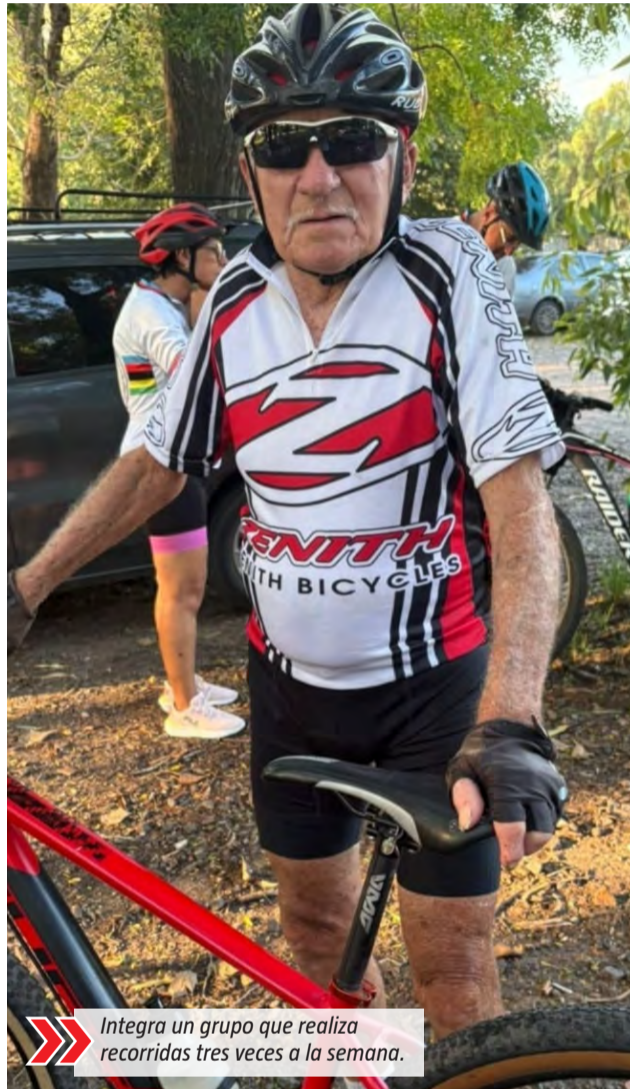
Integra un grupo que realiza recorridos tres veces a la semana.

Además, agregó que muchas personas ya lo reconocen en distintos lugares y lo saludan mientras lleva adelante su recorrido: "Me conocen por todos lados, hasta los patrulleros me saludan. Es algo muy lindo". A su vez, suele viajar