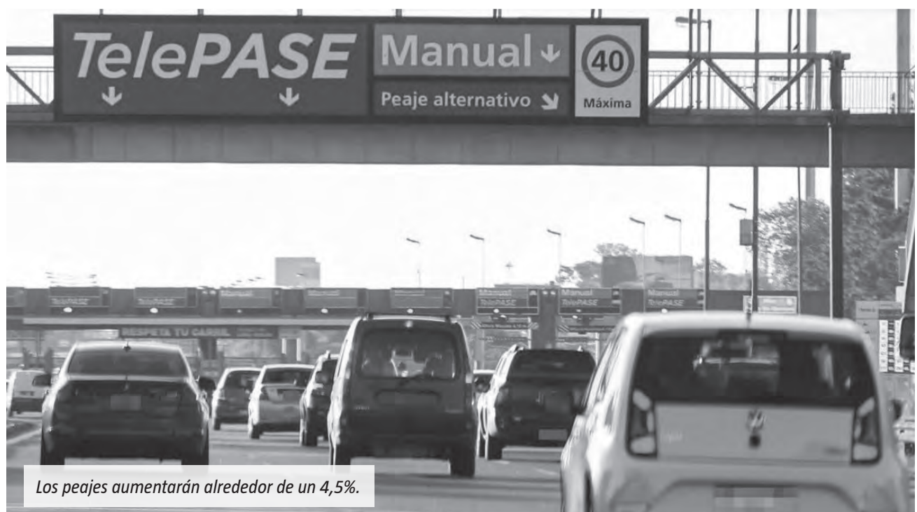
Los peajes aumentarán alrededor de un 4,5%.

Colegios privados: cuotas con subas de entre 4% y 5% en Provincia y CABA.