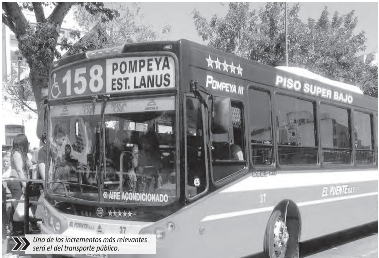
Uno de los incrementos más relevantes será el del transporte público.

En este escenario, distintas consultoras privadas sostienen que junio volverá a mostrar presión sobre el índice de inflación, especialmente por el peso que tienen los servicios y el transporte en el gasto cotidiano de las familias.