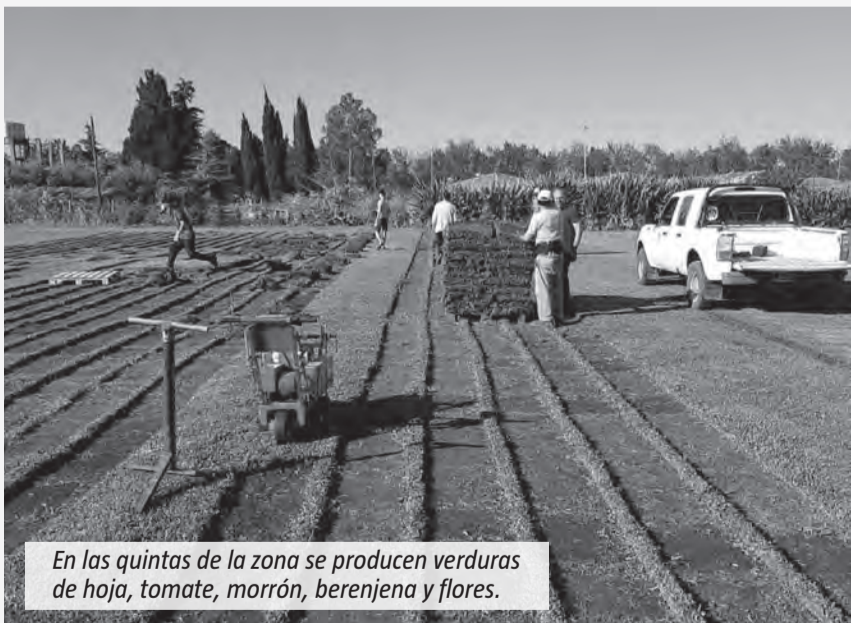
En las quintas de la zona se producen verduras de hoja, tomate, morrón, berenjena y flores.

Las familias que integran la colonia todavía trabajan la tierra y producen verduras, flores y distintos alimentos. En varios casos, los productos se comercializan de forma directa o se envían a mercados de la región.