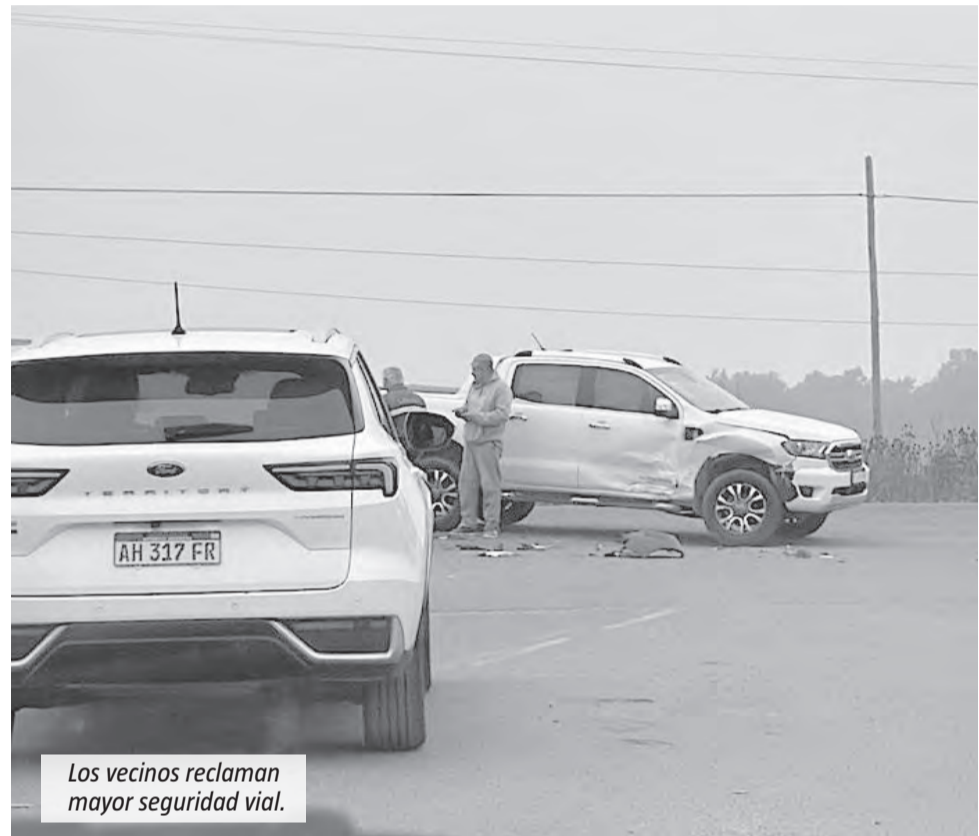
Los vecinos reclaman mayor seguridad vial.

Un choque ocurrió el miércoles cuando una camioneta Renault impactó de frente contra el lateral derecho de una Ford Ranger blanca. A pesar de la violencia del impacto, afortunadamente no se registraron heridos. El sector donde ocurrió el