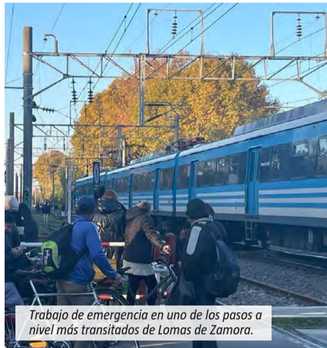
Trabajo de emergencia en uno de los pasos a nivel más transitados de Lomas de Zamora.

“La reiteración de accidentes volvió a generar preocupación entre pasajeros y vecinos”