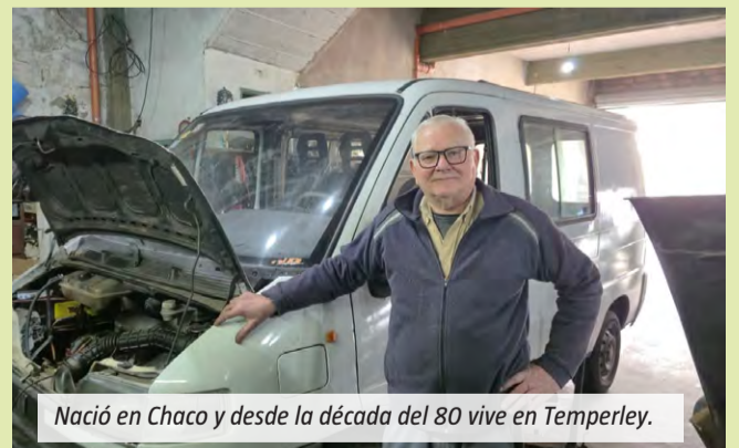
Nació en Chaco y desde la década del 80 vive en Temperley.

Además, explicó que gran parte de los vecinos del barrio lo reconocen y saludan cuando sale por las calles. "Voy a la feria y me paso más hablando con la gente que mirando las cosas. Me genera un re-