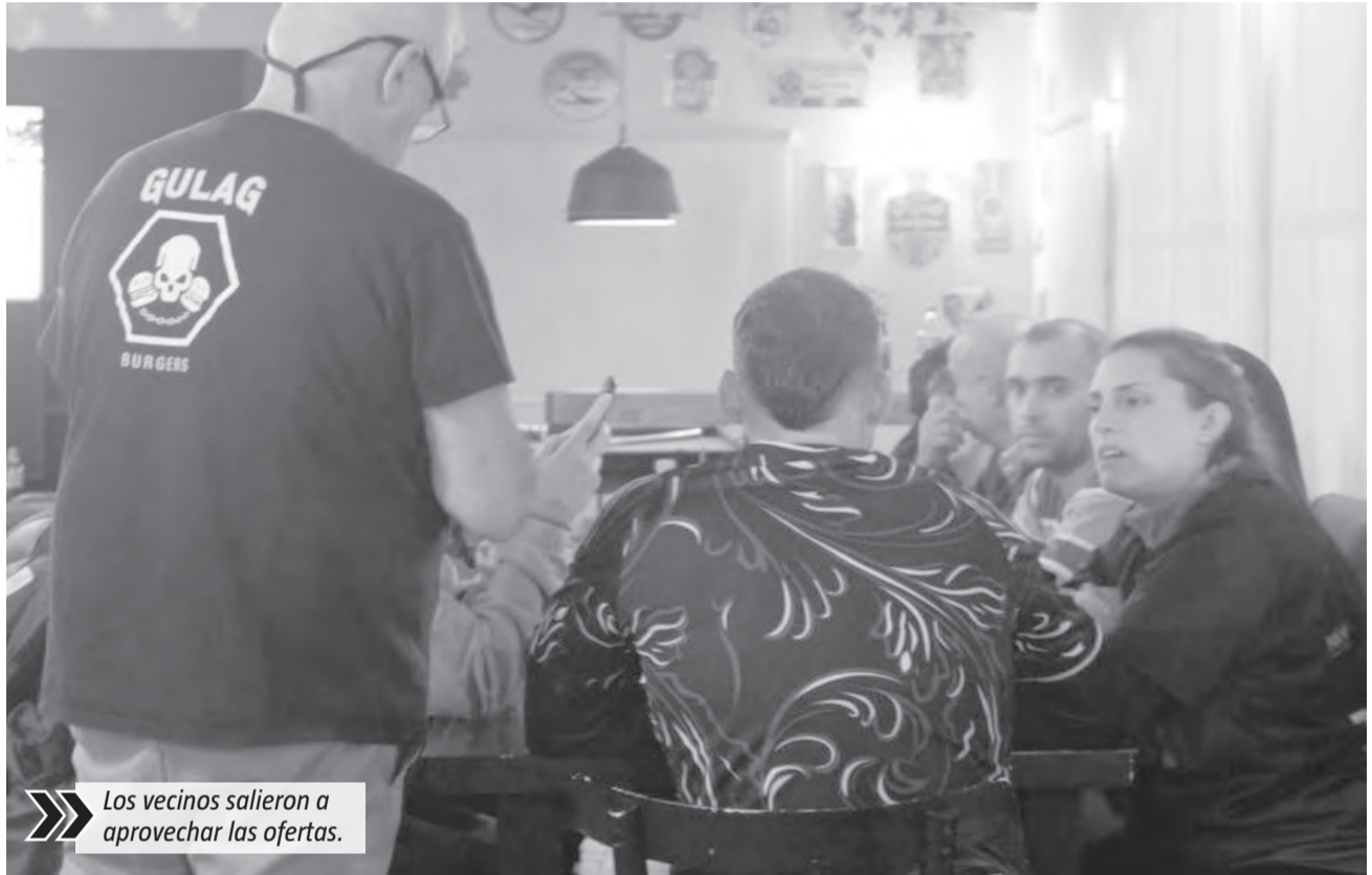
Los vecinos salieron a aprovechar las ofertas.

movimiento fue constante durante toda la jornada. En ALL Canning, Big Kahuna también se sumó a la celebración con una promoción especial que rápidamente llamó la atención de los vecinos: la cheeseburger a 5.000 pesos. La propuesta generó una importante convocatoria y el local trabajó con mesas completas durante gran parte del día. Otro de los comercios que tuvo una gran respuesta fue Fonti Cervecería, donde la cheeseburger simple se ofreció a 7.500 pesos y la doble a 10.000. Allí, muchos vecinos eligieron acercarse en familia o con amigos para aprovechar la fecha especial y compartir la cena. Por su parte, Barstow apostó por sliders a 5.000 pesos y también registró una gran cantidad de clientes. En tanto, Dolas Burger se sumó con un 50% de descuento en toda la carta, mientras que Beerning preparó promociones especiales para acompañar la movida gastronómica. Desde distintos locales destacaron que la convocatoria fue mucho mejor de lo esperada y celebraron el impacto positivo que tuvo la iniciativa conjunta entre las hamburgueserías de la ciudad. "La verdad que trabajamos muchísimo más de lo que imaginábamos para un día tan frío", señalaron desde uno de los comercios a Diario Canning. Además, remarcaron que