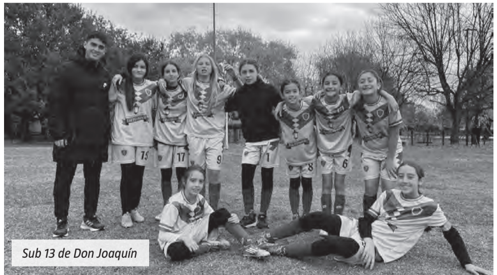
Sub 13 de Don Joaquín

El pasado sábado 23 de mayo, una nueva edición de Canning Gol llevó toda la acción del fútbol infantil de ADUES Sport a los vecinos de la región. En esta oportunidad, el programa estuvo presente en el cruce entre La Martona y Don Joaquín, una jornada que dejó goles, emociones y partidos muy atractivos en las categorías Sexta, Séptima