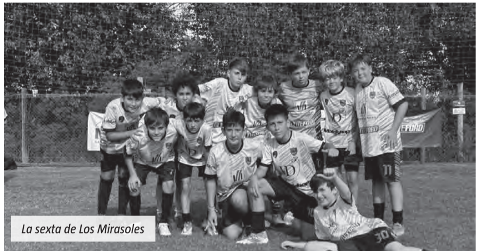
La sexta de Los Mirasoles