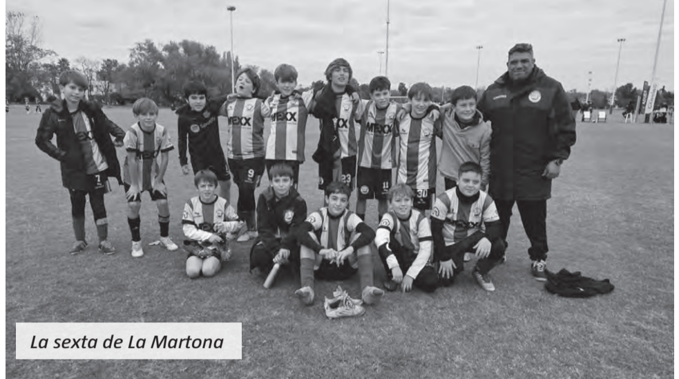
La sexta de La Martona