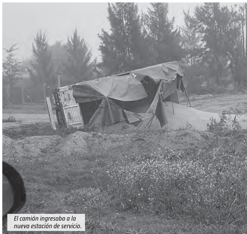
El camión ingresaba a la nueva estación de servicio.

obras que todavía se desarrollan en distintos sectores del predio. La estación de servicio abrió sus surtidores hace pocas semanas, aunque aún continúan trabajos en áreas del estacionamiento y en el sector de servicios. El incidente no afectó el funcionamiento del establecimiento ni frenó el avance de la obra, ya que el material recuperado volvió a ser utilizado en el mismo lugar.