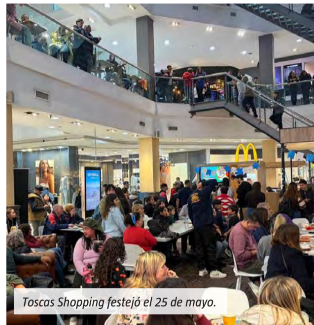
Toscas Shopping festejó el 25 de mayo.

mientras el centro comercial se llenaba de vecinos que recorrían el lugar y disfrutaban de las distintas actividades organizadas para conmemorar la fecha.