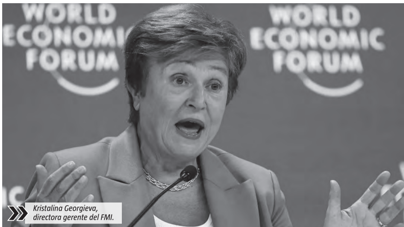
Kristalina Georgieva, directora gerente del FMI.

El informe también incluyó recomendaciones sobre el Impuesto sobre Sociedades y sobre impuestos internos aplicados a productos como tabaco, alcohol y bebidas azucaradas. Además, el organismo consideró que una eventual mejora en la recaudación debería utilizarse para eliminar gradualmente impuestos considerados distorsivos, entre ellos las retenciones a las exportaciones y los impuestos sobre transacciones financieras.