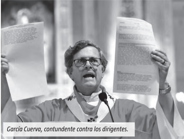
García Cuerva, contundente contra los dirigentes.

En declaraciones a Infobae al Amanecer, y luego de su te-deum por el 25 de Mayo, el clérigo fue enfático en insistir que "todos los dirigentes políticos, empresariales y religiosos nos merecemos la oportunidad de poder dialogar" con el fin de lograr "acuerdos y consensos, pensando fundamentalmente en los que más sufren y lo que la están pasando mal en una Argentina que no quiere vivir así enfrentada".