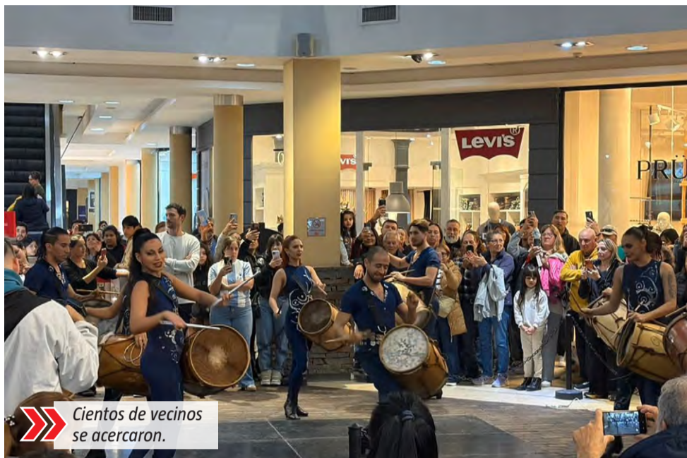
Cientos de vecinos se acercaron.

Uno de los momentos más destacados de la jornada fue la presentación de un grupo de bailarines y bailarinas de malambo, que ofreció un