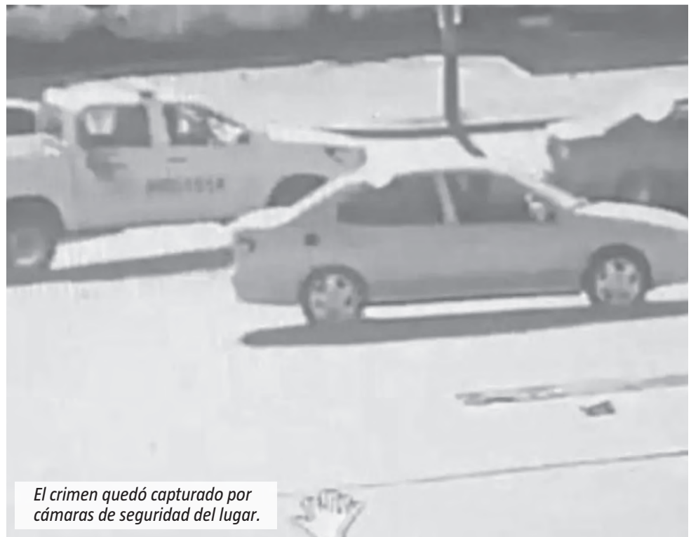
El crimen quedó capturado por cámaras de seguridad del lugar.