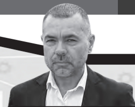
por Francisco Monzón @flmonzon

*Sobre el autor: Maestrando en Comunicación. Docente en UNSAM y UNLZ.