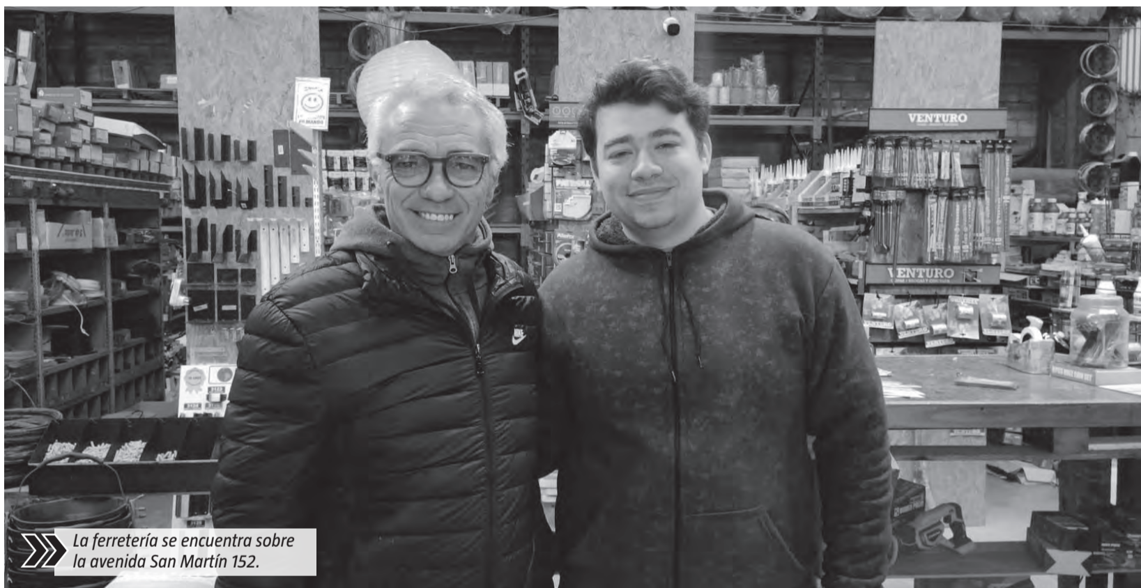
La ferretería se encuentra sobre la avenida San Martín 152.

Durante décadas funcionaron en el histórico local de la esquina