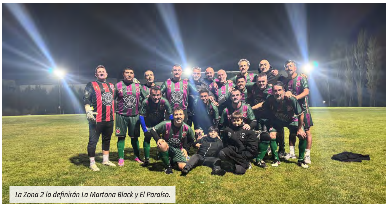
La Zona 2 la definirán La Martona Black y El Paraíso.