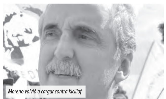
Moreno volvió a cargar contra Kicillof.

El titular de 'Principios y Valores', Guillermo Moreno, arremetió duramente contra el gobernador de la Provincia de Buenos Aires en medio de la interna del peronismo. El ex secretario de comercio aseguró que, antes de que Axel Kicillof sea presidente, prefiere que hayan dos listas. En su paso por Blender volvió a exponerse contra él y lo acusó de ser "pro chino y un anti industrialista", por lo