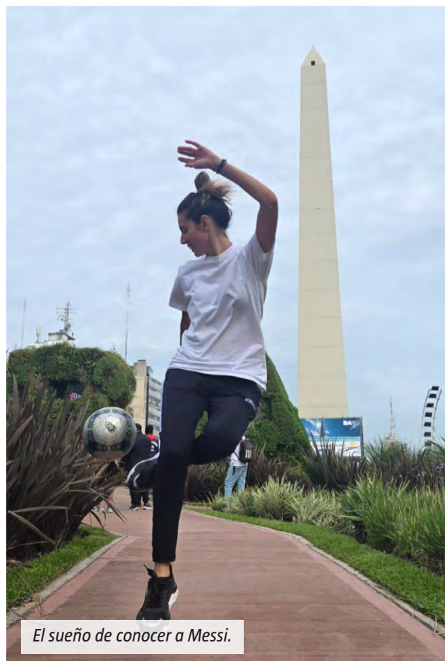
El sueño de conocer a Messi.