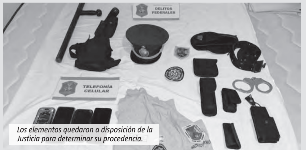
Los elementos quedaron a disposición de la Justicia para determinar su procedencia.

ordenadas por la Justicia. Los investigadores identificaron como sospechosa a una mujer que prestaba servicios en la PSA, aunque al momento del procedimiento se encontraba con licencia médica por cuestiones psiquiátricas. Con autorización del Juzgado de Garantías N°1 de Quilmes, la Policía realizó un allanamiento en una vivienda de Ezeiza vinculada a la acusada. Durante el operativo fueron secuestrados cuatro teléfonos celulares, seis relojes de alta gama, perfumes de distintas marcas, dos valijas que pertenecerían a víctimas, llaves, controles remotos de apertura