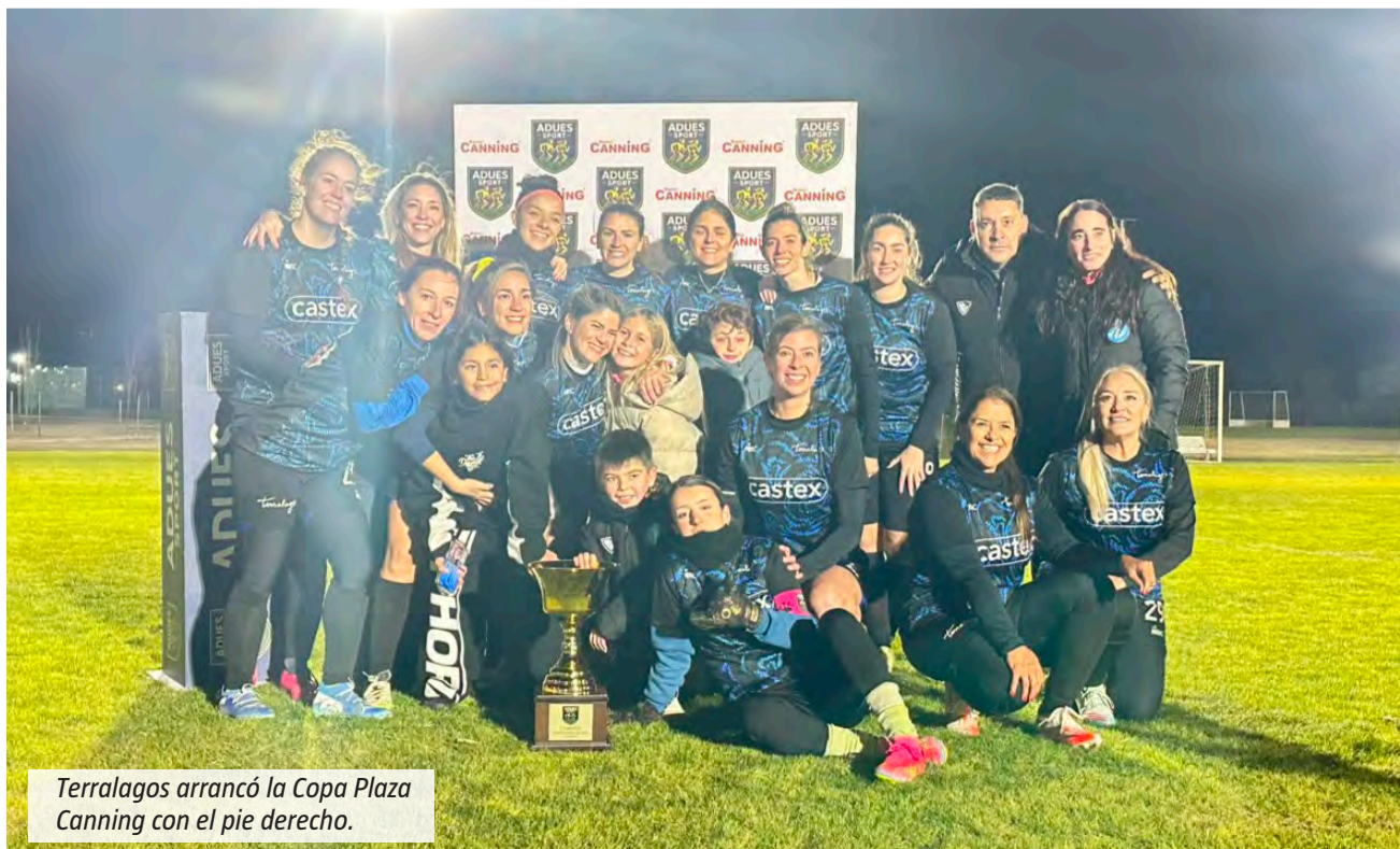
Terralagos arrancó la Copa Plaza Canning con el pie derecho.

la Copa 20° Aniversario Plaza Canning, sino porque fue el homenaje más sentido para la persona que siempre la acompañó en el camino.