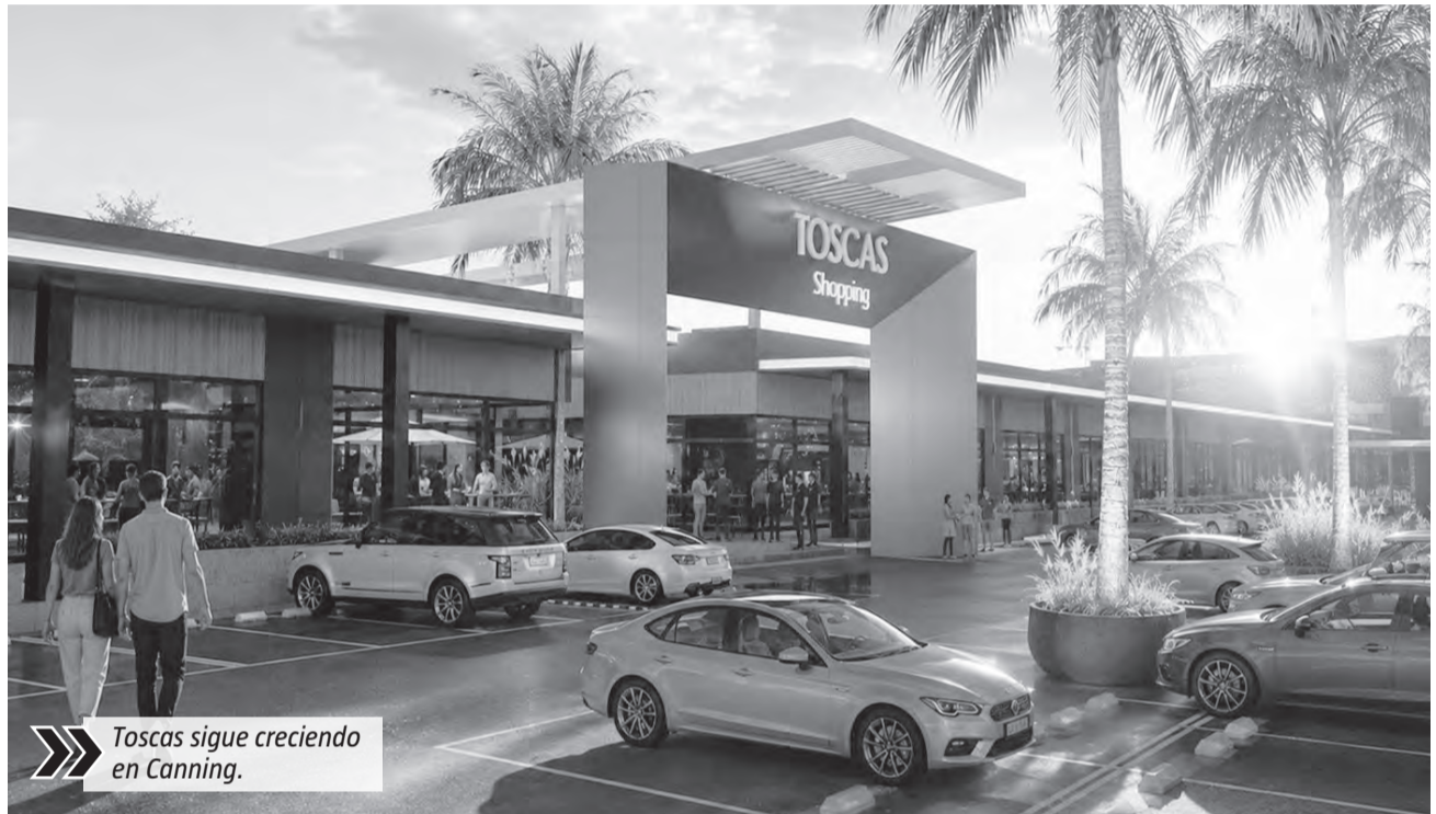
Toscas sigue creciendo en Canning.

Con una superficie total estimada superior a los 25.000 metros cuadrados, la ampliación de Toscas Shopping se perfila como uno de los desarrollos privados más relevantes de los últimos años en Canning. Además de ampliar la oferta comercial, el emprendimiento apunta a consolidar una nueva centralidad urbana sobre Mariano Castex, fortalecer la identidad de la ciudad y acompañar el crecimiento demográfico y económico que viene experimentando la región.