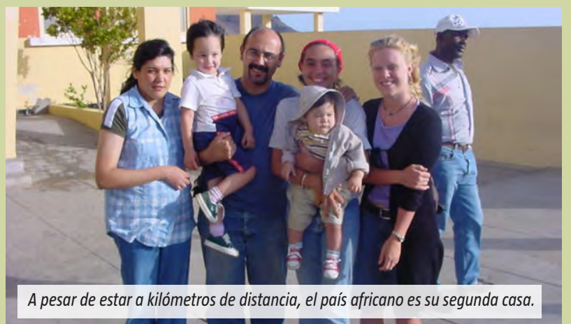
A pesar de estar a kilómetros de distancia, el país africano es su segunda casa.