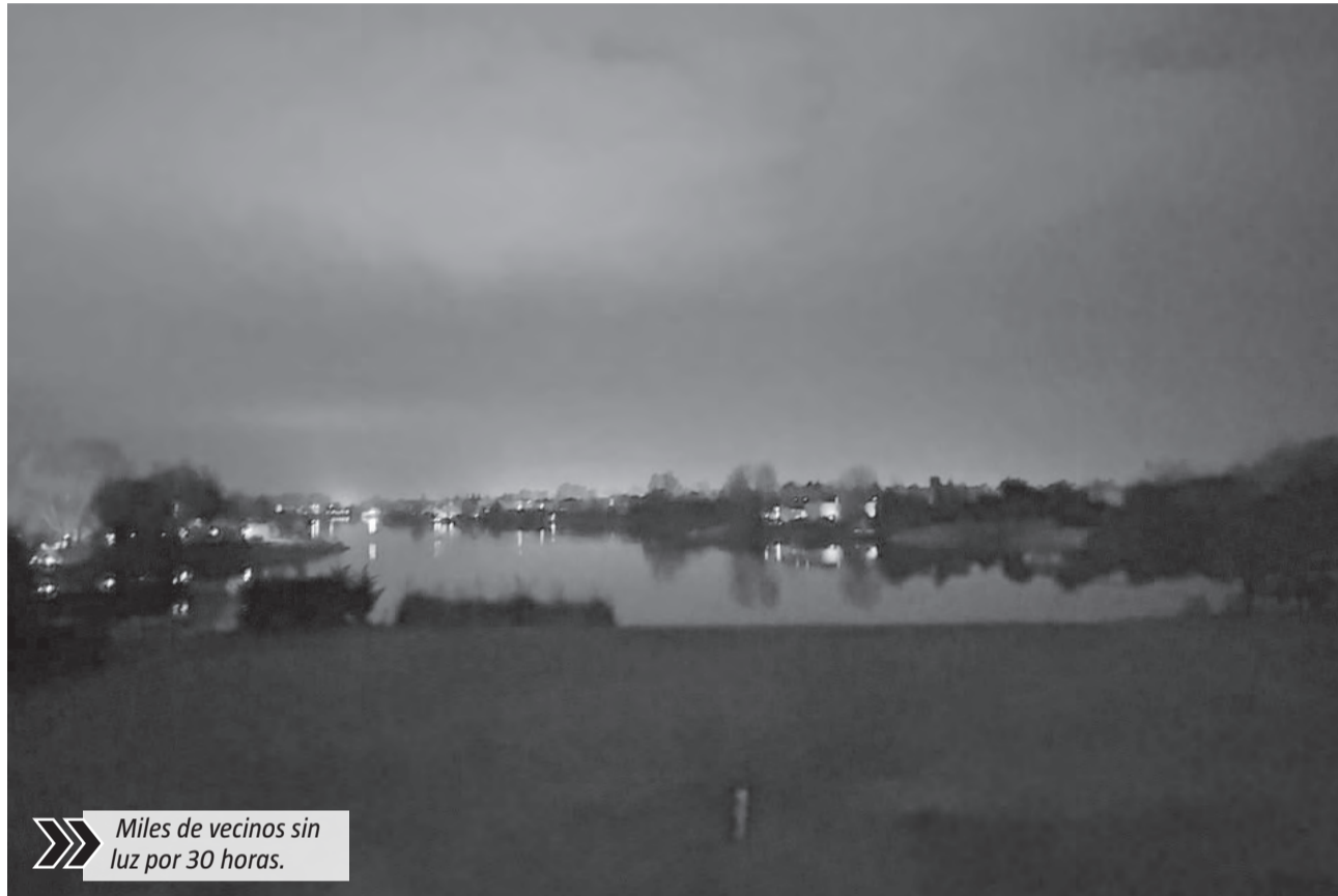
Miles de vecinos sin luz por 30 horas.

Durante el tiempo que duró el corte, los vecinos debieron afrontar una serie de complicaciones derivadas de la falta de energía. La interrupción del servicio impactó en las actividades cotidianas de cientos de familias, mientras que la ausencia de suministro también afectó el funcionamiento de la in-