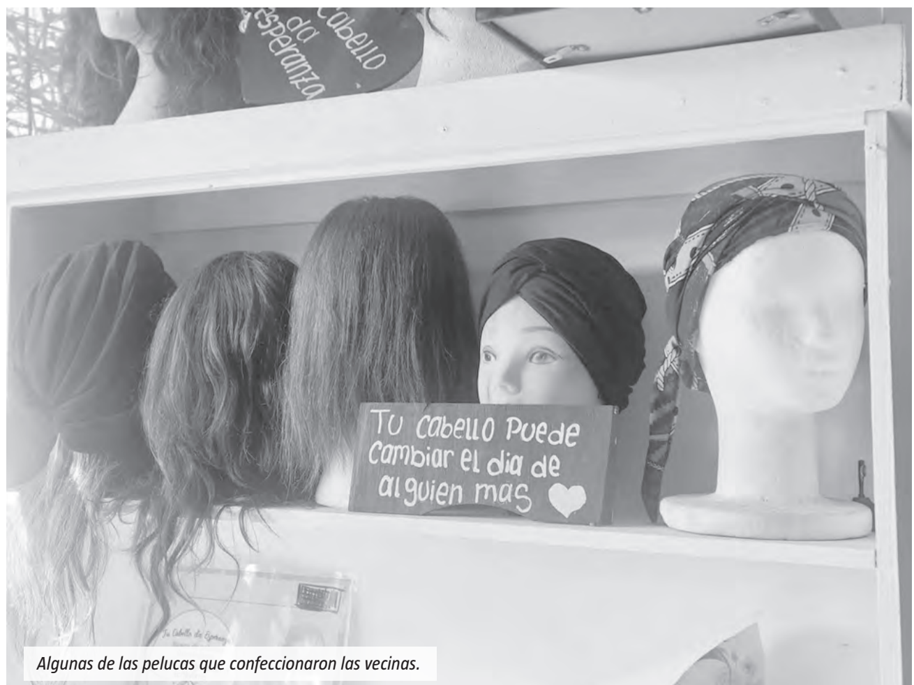
Algunas de las pelucas que confeccionaron las vecinas.

Quienes deseen sumarse pueden obtener más información a través de las redes sociales de Peluqueras Solidarias y Mechones por Sonrisas, donde también se encuentran disponibles los canales de contacto para realizar donaciones o participar como voluntarios.