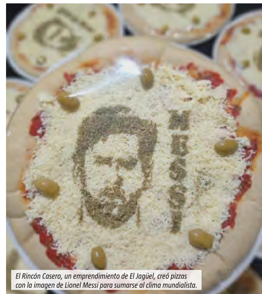
El Rincón Casero, un emprendimiento de El Jagüel, creó pizzas con la imagen de Lionel Messi para sumarse al clima mundialista.

Lo que comenzó como una idea familiar durante la previa del Mundial terminó convirtiéndose en una de las propuestas más comentadas por quienes circulan por el centro de El Jagüel. Agustina Fiurase y su madre, responsables del emprendimiento El Rincón Casero, diseñaron una pizza decorada con la imagen de Lionel Messi. La iniciativa nació mientras pensaban formas de sumarse al clima futbolero. Después de varias pruebas lograron concretar el diseño y comenzaron a ofrecerlo en su puesto callejero. La respuesta fue inmediata. Según contó la emprendedora, muchas personas se detienen para observar la pizza, sacarle fotos o comentar la ocurrencia. Incluso quienes ya conocían sus productos se acercaron nuevamente atraídos por la propuesta mundialista. El puesto funciona por las tardes cerca del cajero del Banco Provincia de El Jagüel. Allí, la pizza con la imagen del capitán argentino pasó a convertirse en el producto más solicitado durante las semanas de competencia.