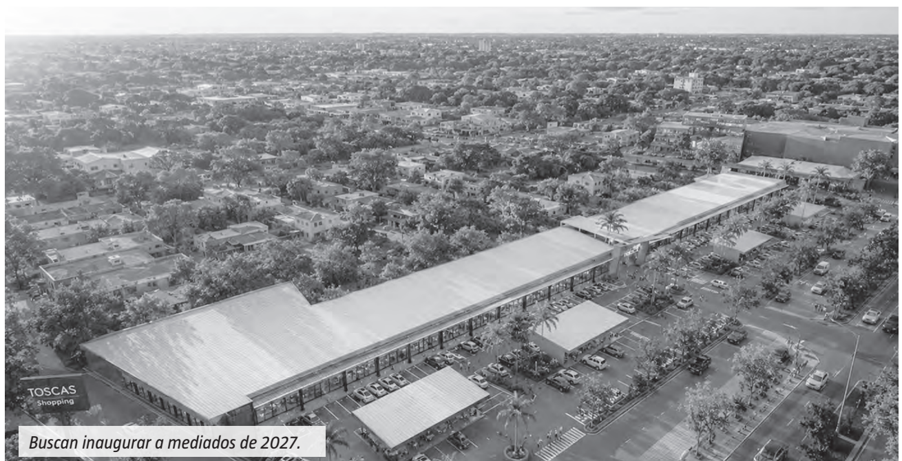
Buscan inaugurar a mediados de 2027.