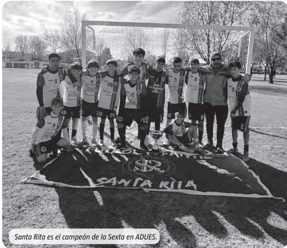
Santa Rita es el campeón de la Sexta en ADUES.

Mientras que en la Octava se vivió como Echeverría del Lago era campeón tres fechas antes de que finalice el campeonato, Santa Rita lo hizo en la última tras vencer a La Martona para la Sexta. Asimismo, resta confirmar los ganadores de la Séptima y Novena. En la primera, La Martona debe esperar a que El Rocío no gane por una diferencia de 10 goles o más para quedarse con el trofeo, mientras que en Novena a Santa Inés le alcanza con un empate ante Lagos en la jornada que fue suspendida por las condiciones de la cancha.