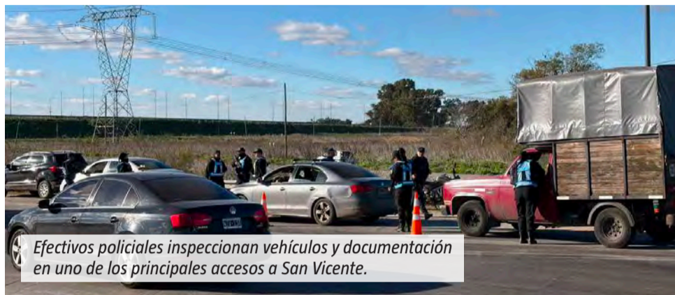
Efectivos policiales inspeccionan vehículos y documentación en uno de los principales accesos a San Vicente.

El operativo vehicular se realizó junto a la nueva estación de servicio Axion y generó demoras en la circulación de los autos.