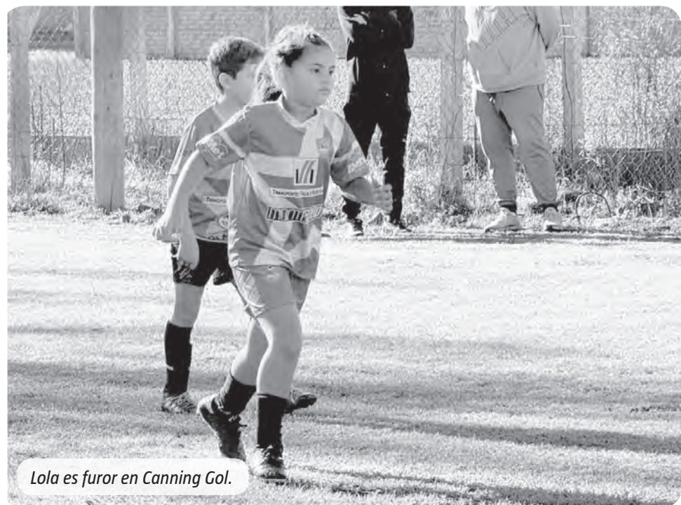
Lola es furor en Canning Gol.