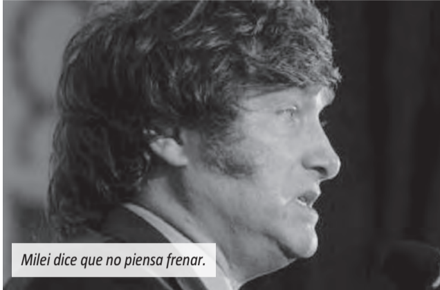
Milei dice que no piensa frenar.

El mandatario consideró que, si los argentinos "siguen abrazando las ideas de la libertad, el país crecerá como nunca antes se vio en su historia". "Ya tenemos 150.000 millones de dólares por RIGI y la economía se va a acelerar, además de las licitaciones por corredores viales. Ya empezamos a ver que el salario real le está ganando a la inflación y la inflación