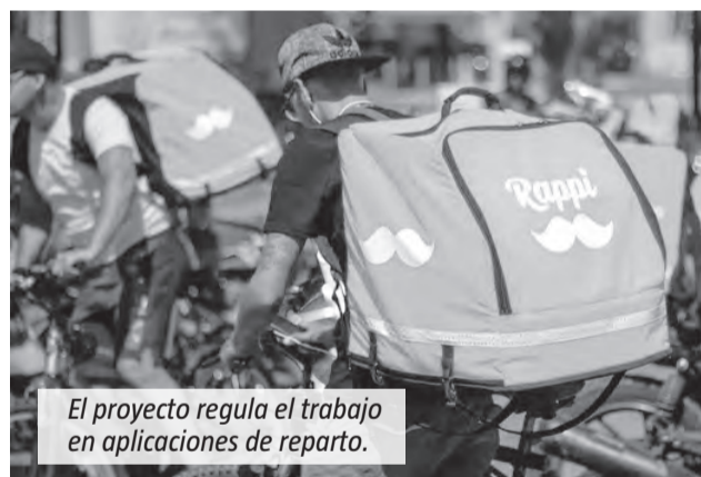
El proyecto regula el trabajo en aplicaciones de reparto.

El texto también establece la creación del Registro de Trabajo Mediante Plataformas Digitales. La inscripción será obligatoria para las empresas, que deberán informar los da-