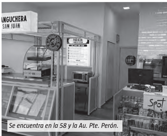
Se encuentra en la 58 y la Au. Pte. Perón.

urbano y comercial que experimenta la región, donde cada año aumenta la circulación de vecinos, turistas y transportistas.