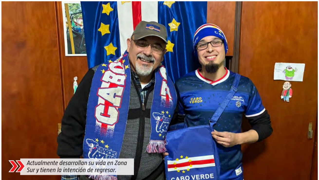
Actualmente desarrollan su vida en Zona Sur y tienen la intención de regresar.

En ese sentido, recordó que también acompañaban habitualmente a la selección nacional y presenciaron algunos encuentros históricos para el deporte caboverdiano: "Nosotros estuvimos ahí cuando Cabo Verde le ganó 3 a 1 a Ghana y hacíamos parte de la barra con un cartel grande". Según contó, el entusiasmo que transmitían desde las tribunas hizo que fueran reconocidos por dirigentes, el entrenador y jugadores locales.