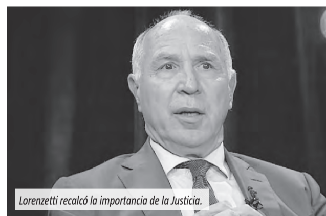
Lorenzetti recalcó la importancia de la Justicia.

El juez de la Corte Suprema Ricardo Lorenzetti se refirió a la situación de la jurisprudencia nacional y aseguró que el "Poder Judicial no tiene independencia porque no maneja su presupuesto". Además, habló sobre la necesidad de completar las vacantes disponibles en el Máximo Tribunal de Justicia "desde la diversidad de género".