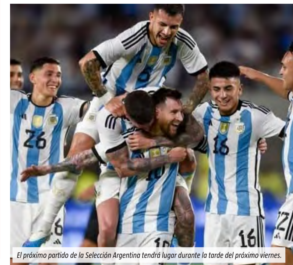
El próximo partido de la Selección Argentina tendrá lugar durante la tarde del próximo viernes.

Diversos especialistas sostienen que los grandes eventos deportivos pueden generar cambios temporales en el comportamiento de los consumidores. Aunque no existe evidencia concluyente de que ganar un Mundial provoque un crecimiento económico, sí se observan efectos vinculados al humor social y al consumo. Estudios citados por economistas muestran que los países campeones registraron en varias ocasiones mejoras en indicadores económicos. Sin embargo, investigadores y especialistas advierten que esos resultados responden a múltiples factores y no pueden atribuirse exclusivamente al fútbol. Donde sí aparecen señales más claras es en determinados rubros comerciales. El entusiasmo generado por la Selección suele impulsar la venta de productos deportivos, artículos temáticos y alimentos para reuniones familiares o con amigos. Además, especialistas en economía conductual señalan que el estado de ánimo influye en muchas decisiones de compra. Por eso, un contexto marcado por la expectativa y el entusiasmo puede traducirse en un mayor movimiento comercial, aunque sea de manera puntual y limitada en el tiempo.