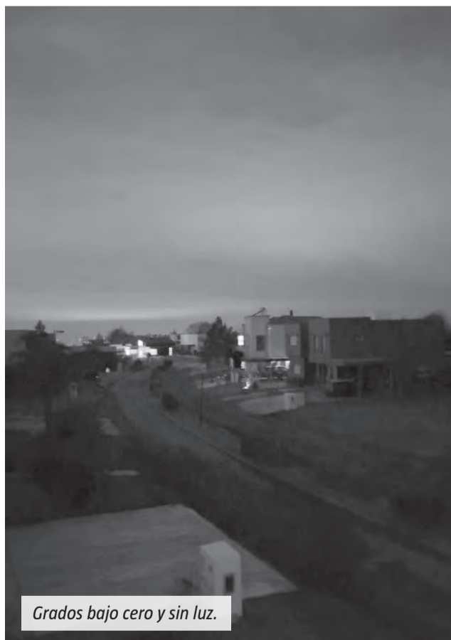
Grados bajo cero y sin luz.