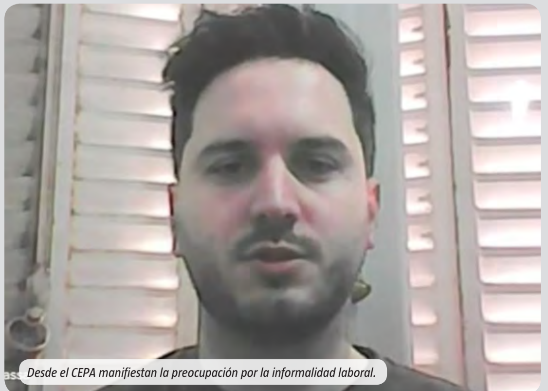
Desde el CEPA manifiestan la preocupación por la informalidad laboral.

siguiente: "Hay empleo estable pero crece la informalidad". En ese sentido, aclaró: "Hay un cambio en el mercado de trabajo. Desde que asumió Milei viene aumentando significativamente la informalidad. Por ejemplo, de trimestre a trimestre las personas que trabajan en blanco cayeron un 2 por ciento y las que lo hacen en negro aumentaron un 5 por ciento. La realidad es que el trabajo que se está creando es fundamentalmente en negro". Esto deriva en un traslado que se certifica con la chance de mucha gente de apelar a establecerse como monotributista. "Las personas que perdieron su trabajo pasaron a un régimen de monotributista o directamente trabajan en negro, y eso es una gran preocupación", completó.