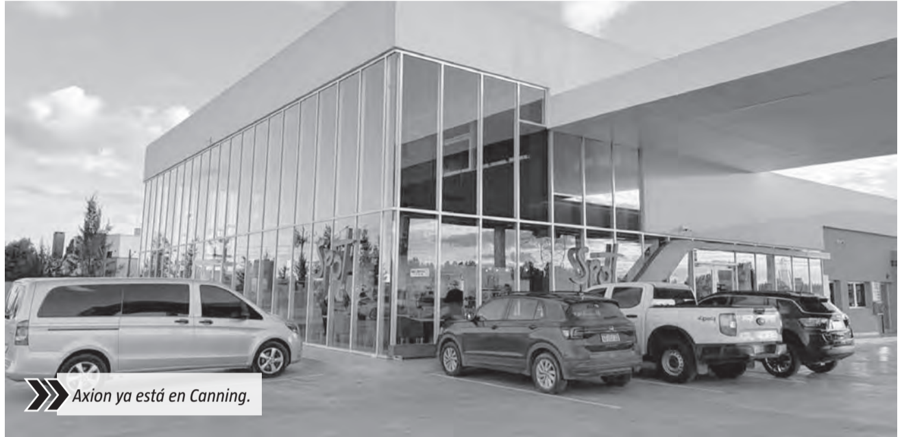
Axion ya está en Canning.

Más adelante, sobre la misma traza, también opera una estación Puma Energy, que amplió la oferta disponible sobre la Ruta 58 y atiende tanto a vecinos como a