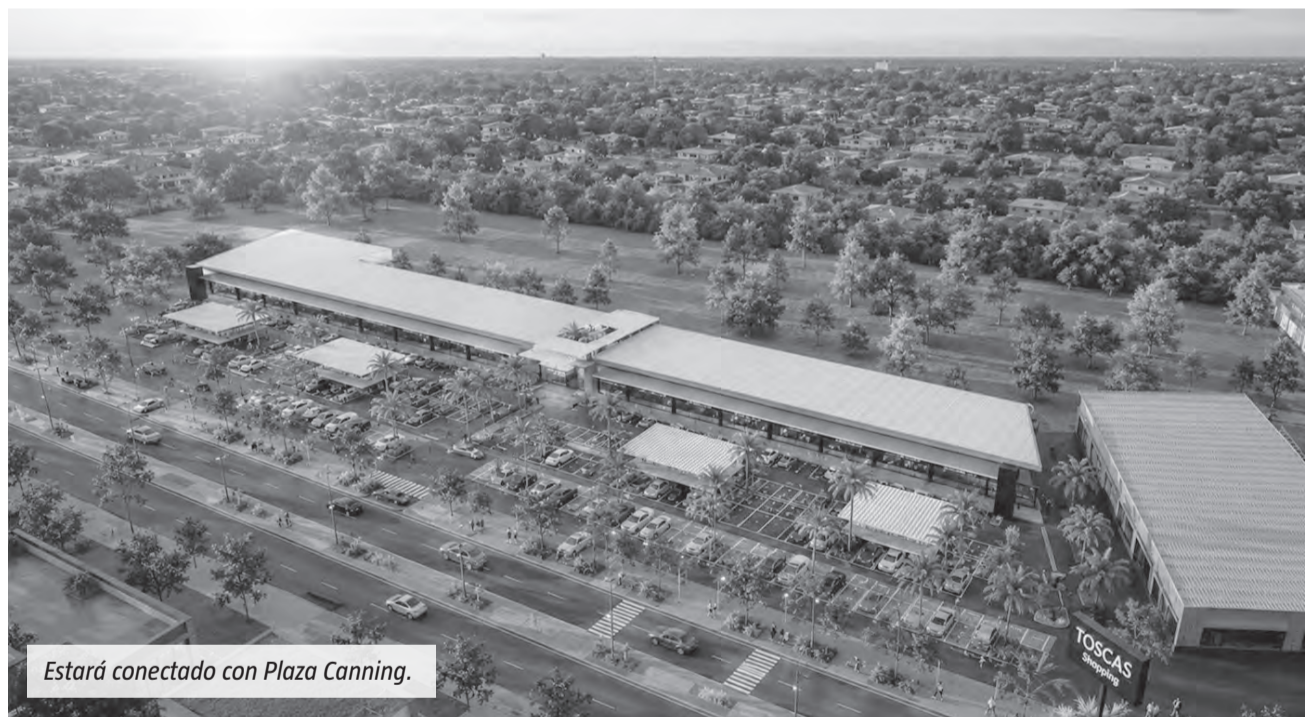
Estará conectado con Plaza Canning.