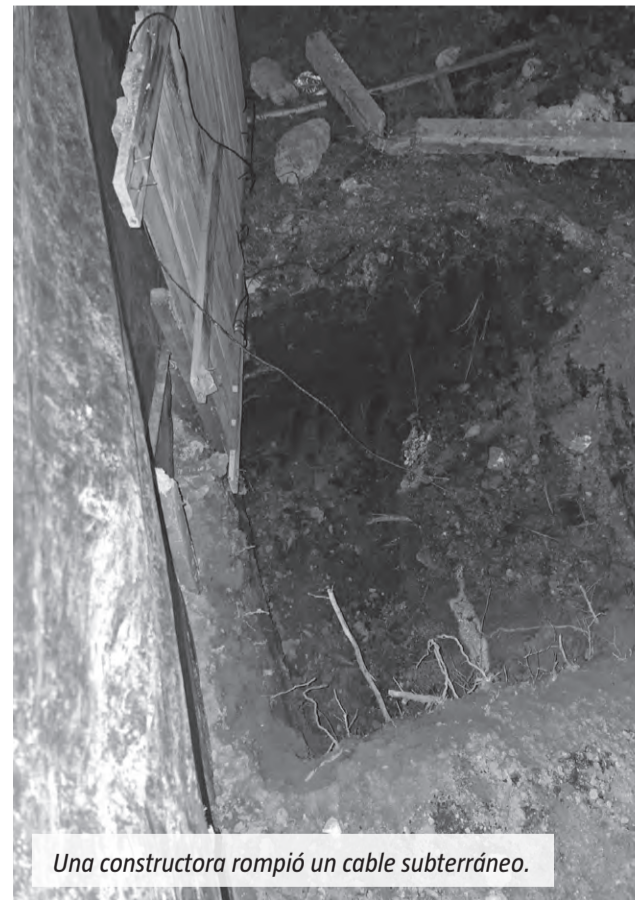
Una constructora rompió un cable subterráneo.