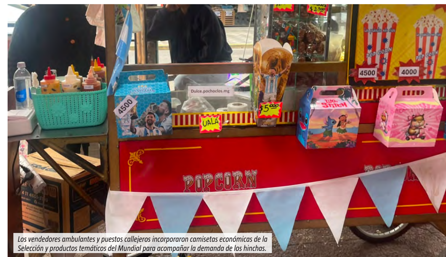
Los vendedores ambulantes y puestos callejeros incorporaron camisetas económicas de la Selección y productos temáticos del Mundial para acompañar la demanda de los hinchas.

El clima mundialista también transformó la oferta en la vía pública. En los puestos de pochoclos aparecieron cajas con la imagen de Messi, De Paul y la Copa del Mundo para atraer a los más chicos, mientras que muchos vendedores ambulantes dejaron de lado por unas semanas los habituales auriculares, cargadores, guantes o gorros para ofrecer camisetas económicas de la Selección. La indumentaria celeste y blanca pasó a ocupar el lugar de los productos que normalmente predominan en las calles comerciales de la región. En este Día del Padre, la historia refleja cómo una pasión puede convertirse en un legado familiar capaz de trascender generaciones, unir proyectos y construir un futuro compartido.