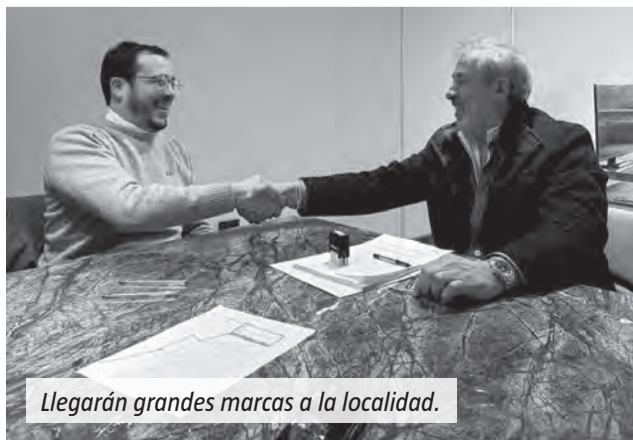
Llegarán grandes marcas a la localidad.