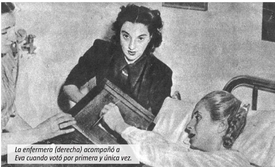
La enfermera (derecha) acompañó a Evita cuando votó por primera y única vez.