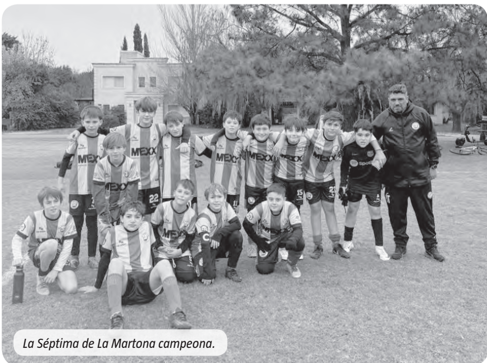
La Séptima de La Martona campeona.