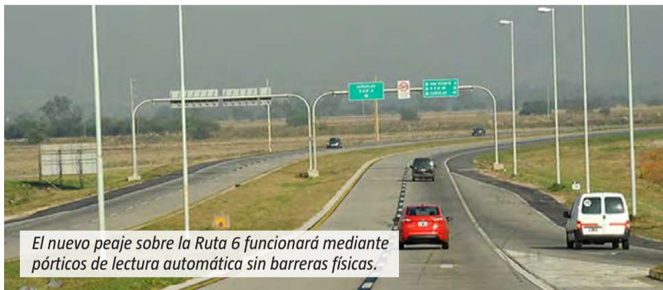
El nuevo peaje sobre la Ruta 6 funcionará mediante pórticos de lectura automática sin barreras físicas.

La Provincia aprobó los valores que tendrá el futuro peaje sobre la Ruta 6. Aunque las tarifas entran en vigencia este viernes.