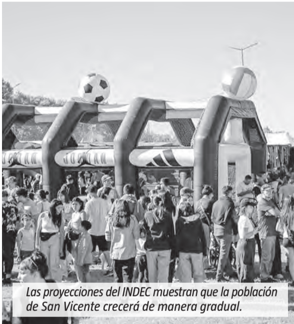
Las proyecciones del INDEC muestran que la población de San Vicente crecerá de manera gradual.

En San Vicente la proyección muestra un crecimiento poblacional cercano al 3% para 2035. La población pasaría de 98.977 habitantes en 2022 a 102.009 en 2035, lo que equivale a unas 3.032 personas más en el período. En la estimación por sexo, se indica que hacia 2035 habría 49.649 mujeres y 52.360 varones. El crecimiento sería gradual: 99.868 habitantes en 2026 y 101.627 en 2034.