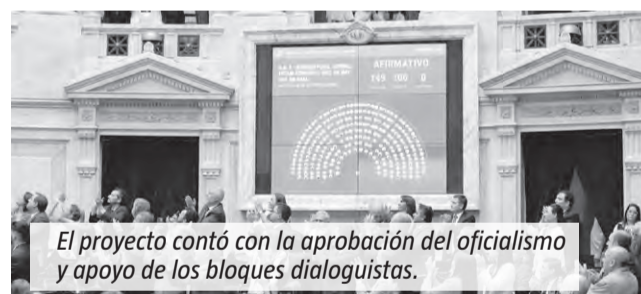
El proyecto contó con la aprobación del oficialismo y apoyo de los bloques dialoguistas.

La norma establece una pena máxima de 15 años para homicidios, robos violentos, abusos sexuales y secuestros. En casos con condenas menores a 10 años, prevé alternativas como servicios comunitarios, monitoreo electrónico, prohibición de acercamiento a la víctima y reparación integral del daño, entre otras medidas.