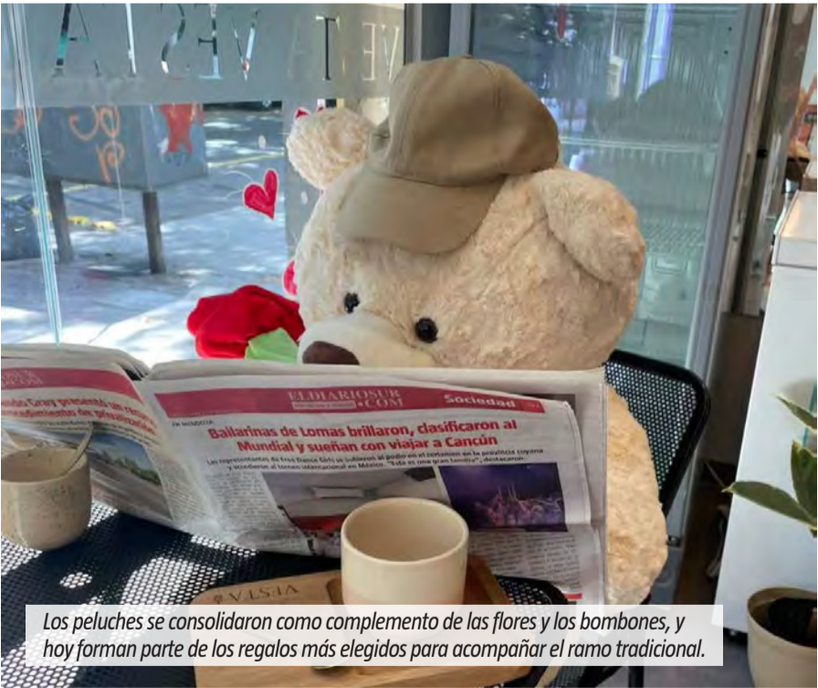
Los peluches se consolidaron como complemento de las flores y los bombones, y hoy forman parte de los regalos más elegidos para acompañar el ramo tradicional.

No todas las celebraciones se viven de la misma manera. Algunas parejas eligen alternar sorpresas año tras año. Otras preparan salidas a comer fuera del distrito o desayunos en la cama. Una pareja que espera la llegada de un bebé señaló que este año la atención está puesta en otro proyecto, aunque rescatan el valor del gesto. “Son detalles que suman a la pareja”, afirmaron, tras 15 años juntos. También están quienes atraviesan su primer 14 de febrero. “Es nuestro primer San Valentín”, contó una pareja joven, que anticipó un “montón de regalos”.