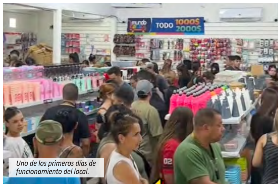
Uno de los primeros días de funcionamiento del local.

Mundo Barato también ofrece artículos de cotillón, accesorios, bijouterie, decoración para el hogar y algunos productos de ferretería, ampliando la oferta más allá del bazar y la librería.