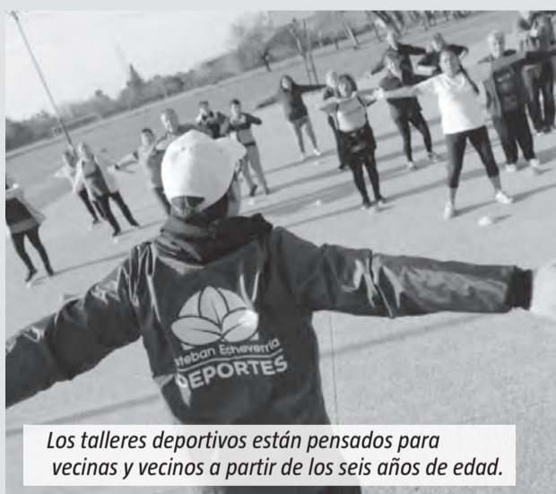
Los talleres deportivos están pensados para vecinas y vecinos a partir de los seis años de edad.

Las actividades se llevan adelante en el Campo de Deportes del Centenario, el Campo de Deportes Santa María, Campo Amat, el Skatepark de Monte Grande, plazas, centros comunitarios y centros de