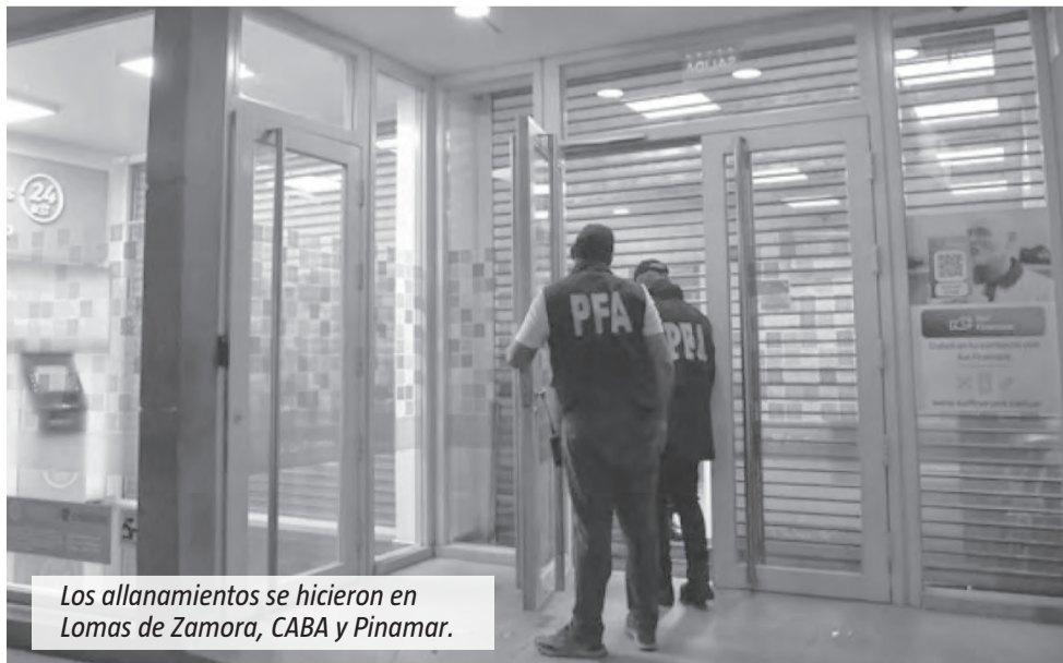
Los allanamientos se hicieron en Lomas de Zamora, CABA y Pinar del Rio.

comienzos de diciembre se activó un “protocolo de