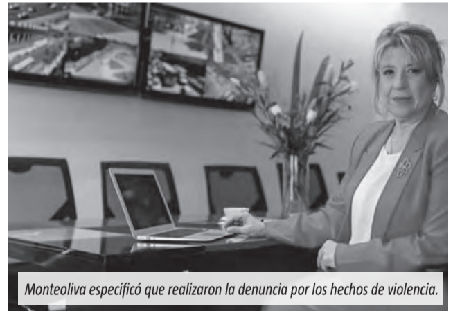
Monteoliva especificó que realizaron la denuncia por los hechos de violencia.

La ministra de Seguridad, Alejandra Monteoliva, se refirió a los incidentes que ocurrieron durante el debate del proyecto de ley de la reforma laboral en el Senado y aseguró que ya se formalizó una denuncia contra grupos con “características violentas”.