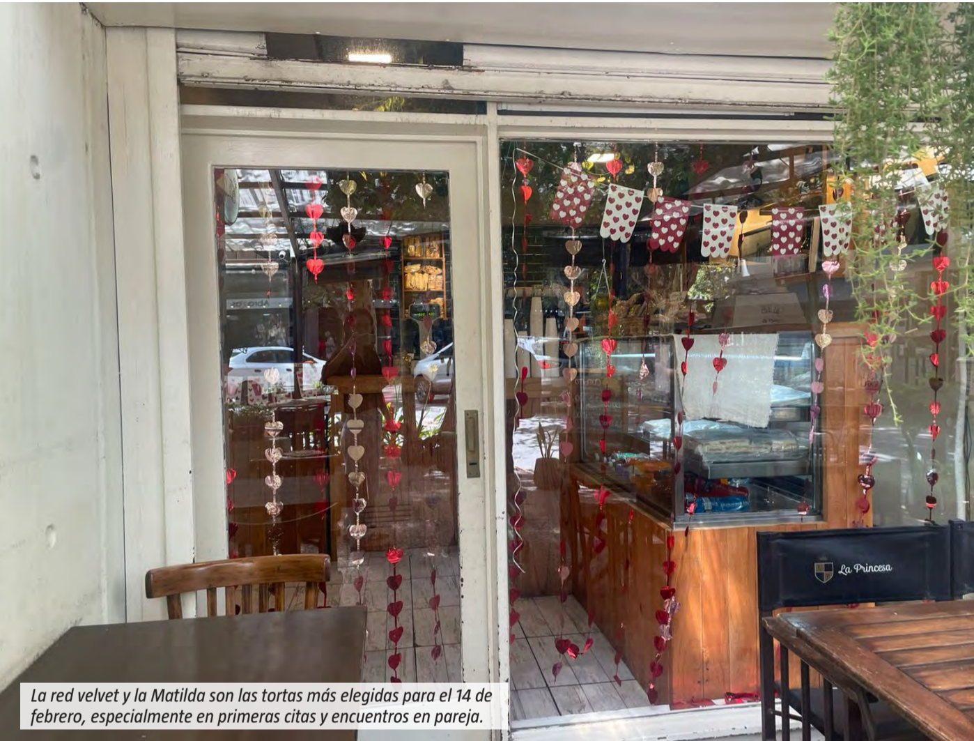
La red velvet y la Matilda son las tortas más elegidas para el 14 de febrero, especialmente en primeras citas y encuentros en pareja.

Los bares y cafeterías de Monte Grande reciben una jornada con expectativas. Si bien no suelen trabajar con reservas, tienen pedidos especiales de tortas, medialunas y sándwiches de miga. “Vienen muchos adolescentes a las mesitas”, cuentan desde uno de los locales. Las primeras citas son moneda corriente y, aseguran, los nervios se notan. “Más o menos, están más nerviosos que sueltos”, describen entre risas. El clima, sin embargo, es distendido. “Acá sale todo bien”, aseguran. En las cafeterías también aseguran que, además de los pedidos tradicionales, hay tortas que se repiten cada 14 de febrero. Entre las más elegidas mencionan la red velvet y la Matilda, asociadas a la estética y al clima romántico de la fecha. Son opciones que suelen acompañar las primeras citas o celebraciones en pareja.