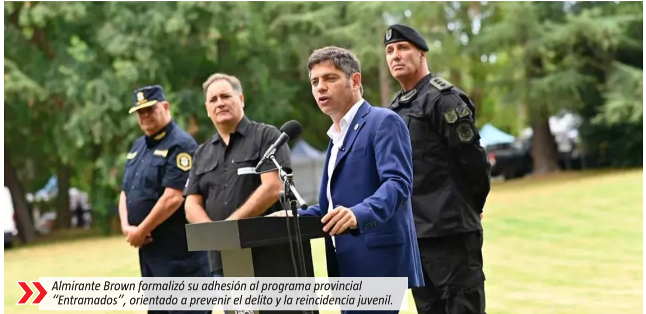
Almirante Brown formalizó su adhesión al programa provincial "Entramados", orientado a prevenir el delito y la reincidencia juvenil.

programa "Involucrados", enmarcado en la Justicia Restaurativa, que apunta a que jóvenes puedan finalizar sus estudios o incorporarse al mundo laboral. En ese marco, explicó que la adhesión a "Entramados" permite reforzar la prevención del delito y la reincidencia en niños, niñas y adolescentes. El gobernador Axel Kicillof indicó que la política pública se implementa en 30 distritos bonaerenses y que incluye acciones vinculadas a la revinculación educativa, el abordaje de consumos problemáticos y la formación para el trabajo. Por su parte, el ministro de Seguridad, Javier Alonso, sostuvo que la iniciativa forma parte