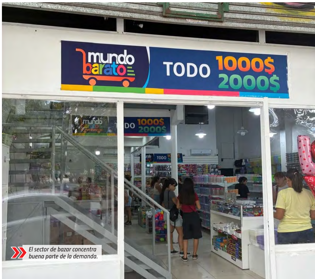
➤ El sector de bazar concentra buena parte de la demanda.

El sector de bazar concentra buena parte de la demanda, con productos pensados para el uso cotidiano y compras rápidas, sin necesidad de comparar precios entre distintas marcas.