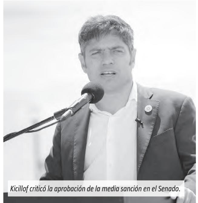
Kicillof criticó la aprobación de la media sanción en el Senado.

“Llamar modernización a esto es una burla porque lo que se busca no es mejorar a los que están por abajo” de la pirámide social, sin poder acceder a sus derechos laborales, “sino bajar a los que están por arriba, quitándoles beneficios”, explicó en declaraciones a El Destape.