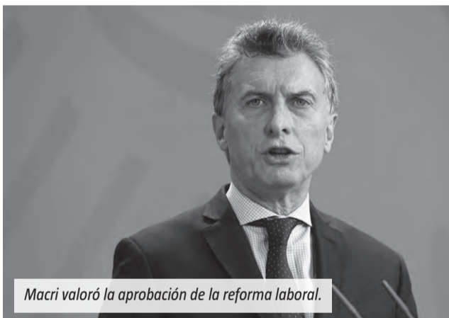
Macri valoró la aprobación de la reforma laboral.

En un nuevo guiño de apoyo al Gobierno, el expresidente Mauricio Macri valoró la aprobación del Senado al proyecto de ley de la reforma laboral y consideró que era “un paso adelante en la dirección correcta”. “Después de años en los que lu-