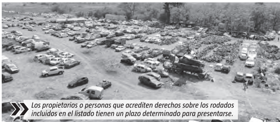
Los propietarios o personas que acrediten derechos sobre los rodados incluidos en el listado tienen un plazo determinado para presentarse.

El Municipio de Esteban Echeverría informó que avanza con un nuevo proceso de compactación de vehículos que permanecen alojados en depósitos municipales, policiales o judiciales del distrito. La medida se enmarca en el Programa Nacional de Descontaminación, Compactación y Disposición Final (PRODECO) y alcanza a autos secuestrados en distintos operativos realizados en los últimos años. Según se indicó desde el Municipio, el procedimiento apunta a liberar espacio, mejorar las condiciones ambientales y reforzar la seguridad, ya que muchos de los vehículos