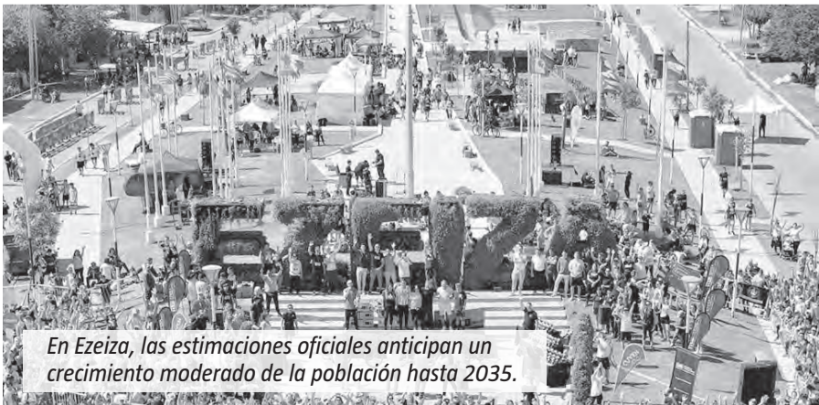
En Ezeiza, las estimaciones oficiales anticipan un crecimiento moderado de la población hasta 2035.

La proyección para Ezeiza también indica un crecimiento moderado. La población de este distrito pasaría de 200.500 habitantes en 2022 a 203.364 en 2035, lo que implica un aumento de 1,4% (aproximadamente 2.864 personas más). Según la estimación oficial, habría 100.414 mujeres y 102.950 varones hacia 2035. El crecimiento por año es paulatino, con proyecciones intermedias que rondan los 201.465 en 2026 y más de 203.000 hacia 2034.