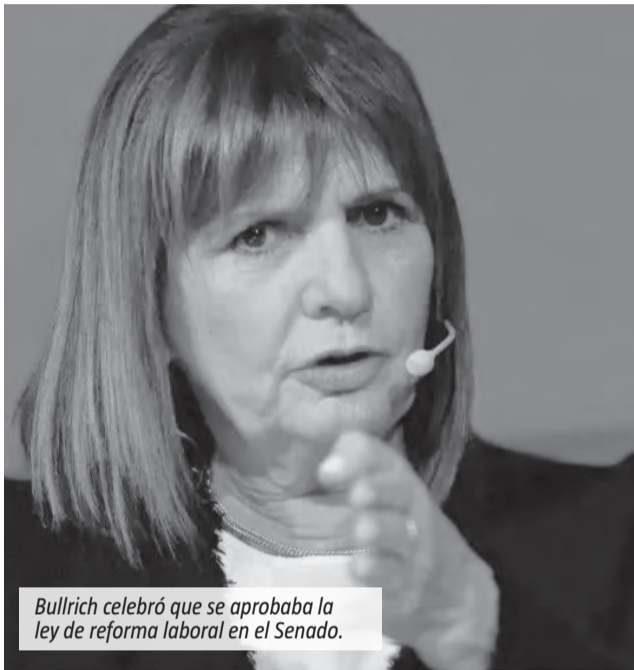
Bullrich celebró que se aprobaba la ley de reforma laboral en el Senado.

En declaraciones a A24, recalcó: “Es histórico que 42 senadores hayan votado una reforma laboral, que da tantas certezas, que termina con tantos problemas que hemos tenido, deformación total del mundo del trabajo, conflictividad permanente”.