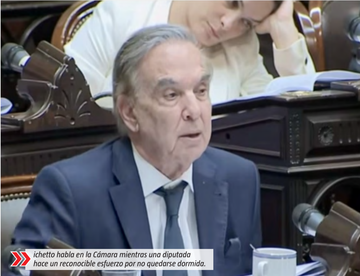
Pichetto habla en la Cámara mientras una diputada hace un reconocible esfuerzo por no quedarse dormida.

"Se ha votado el presupuesto nacional la inversión en educación primaria, en educación secundaria, en elementos de contención, en fondos de la universidad, y todo ha ido a la baja en el presupuesto 2026", continuó exponiendo Pichetto, para después explicar el fondo real del debate. "Estas son medidas de efecto que sirven para el lucimiento de determinados senadores o ex ministras, que ahora parece que tampoco están conformes con 14, quieren bajar a 13, a 12 o a 10, porque eso las ubica más a la derecha y las pone en un lugar donde el facilismo discursivo satisface a algunos sectores", desafió Pichetto, para luego reconocer: "Por supuesto que siempre un hecho de inseguridad, una muerte de un inocente, o un crimen que se produce, nunca se va a poder justificar el dolor de la familia de esa persona que murió. Siempre es importante el hecho, pero mucho más cuando se reproduce mediáticamente con un