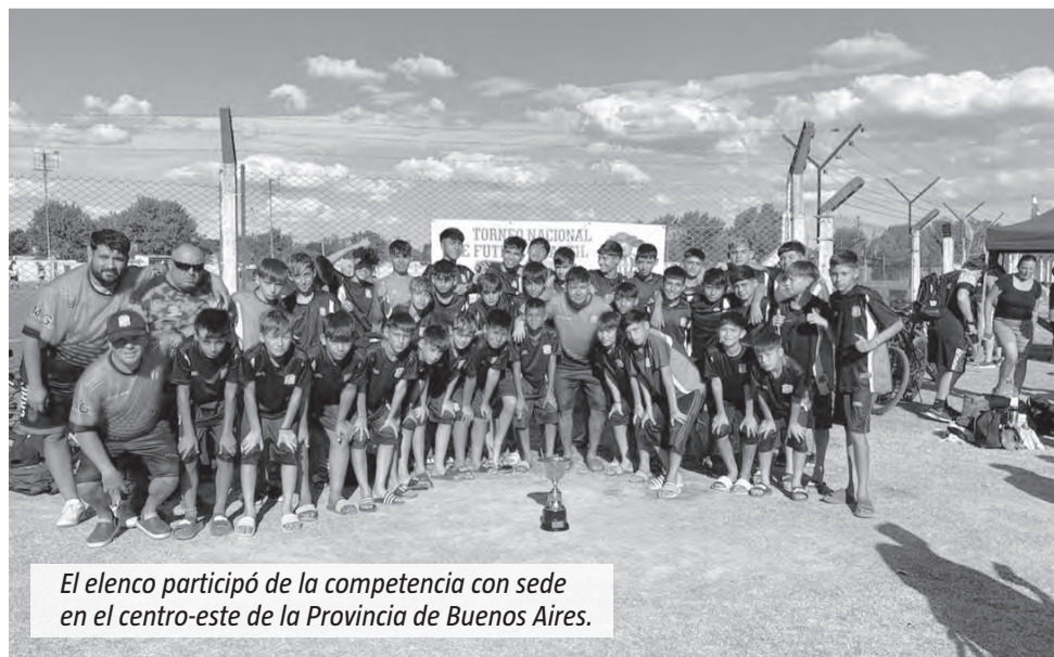
El elenco participó de la competencia con sede en el centro-este de la Provincia de Buenos Aires.

Para los chicos es un gran momento. Y, palpitando el panorama, lo dejaron entrever al unísono: "Venimos hace mucho tiempo de no jugar contra clubes de la A, y me genera mucha curiosidad jugar con alguno de esos clubes como River, Racing, Boca".