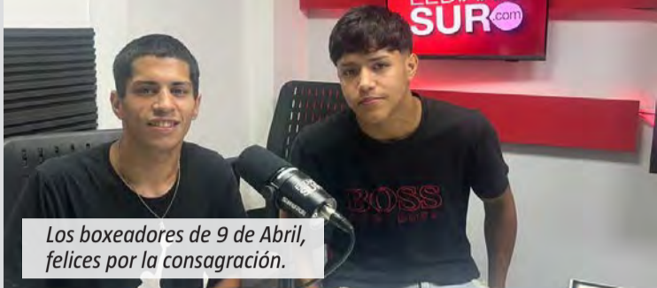
Los boxeadores de 9 de Abril, felices por la consagración.