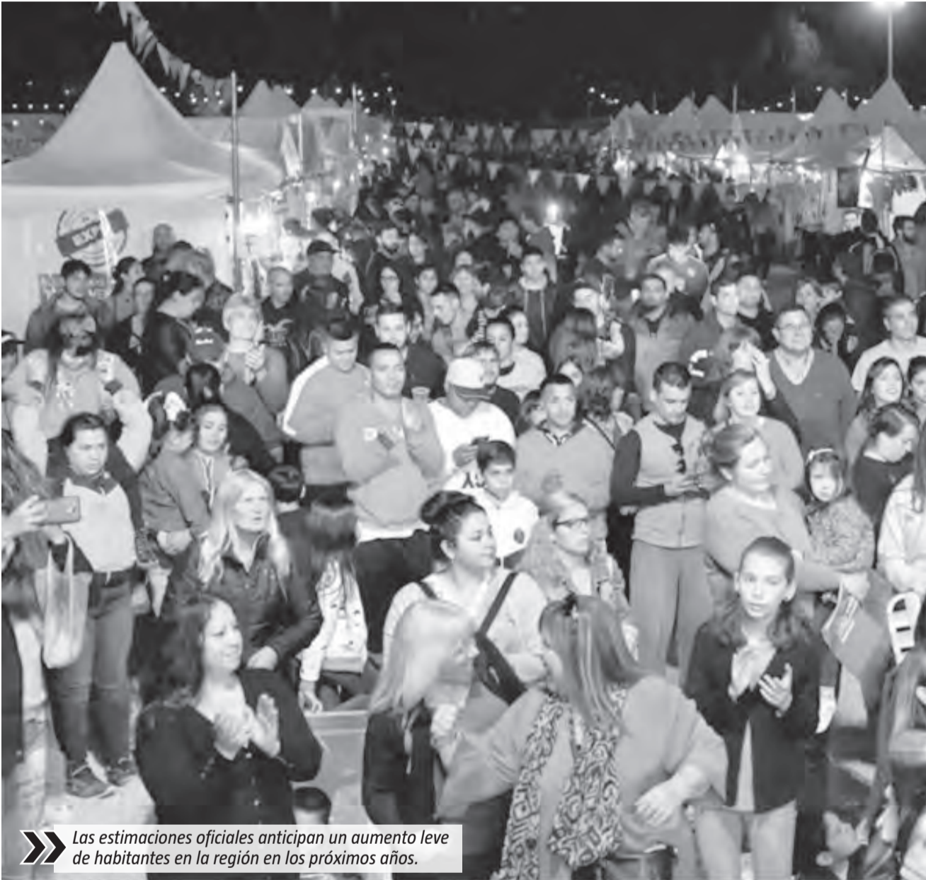
Las estimaciones oficiales anticipan un aumento leve de habitantes en la región en los próximos años.