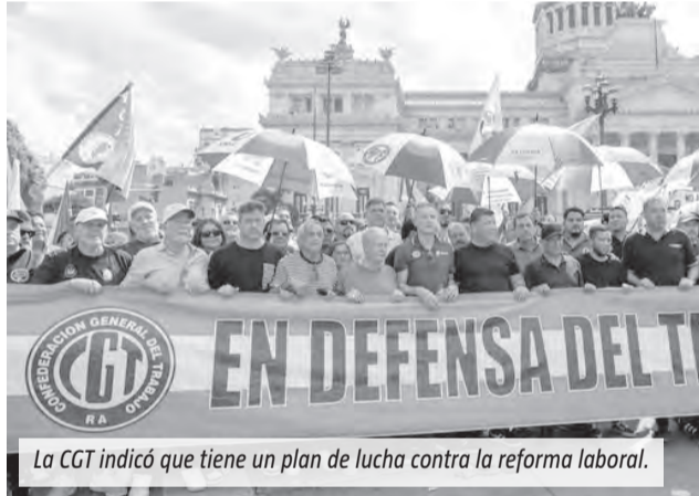
La CGT indicó que tiene un plan de lucha contra la reforma laboral.

Tras la media sanción de la reforma laboral en el Senado, la CGT volvió a criticar la iniciativa y advirtió que todavía faltan varios pasos antes de entrar en vigencia. El siguiente es su tratamiento en Diputados y recalcó que continuará su plan de acción “en todos los ámbitos necesarios”,