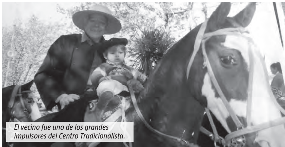
El vecino fue uno de los grandes impulsores del Centro Tradicionalista.