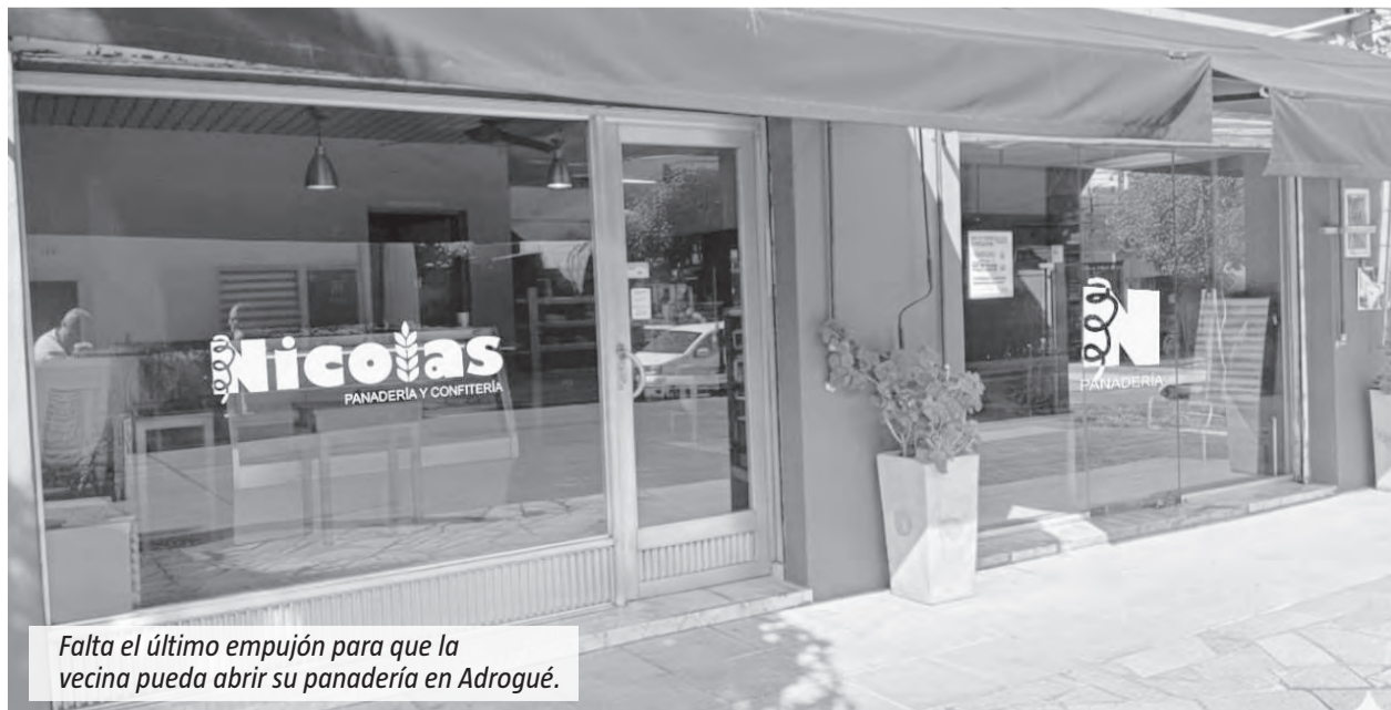
Falta el último empujón para que la vecina pueda abrir su panadería en Adrogué.