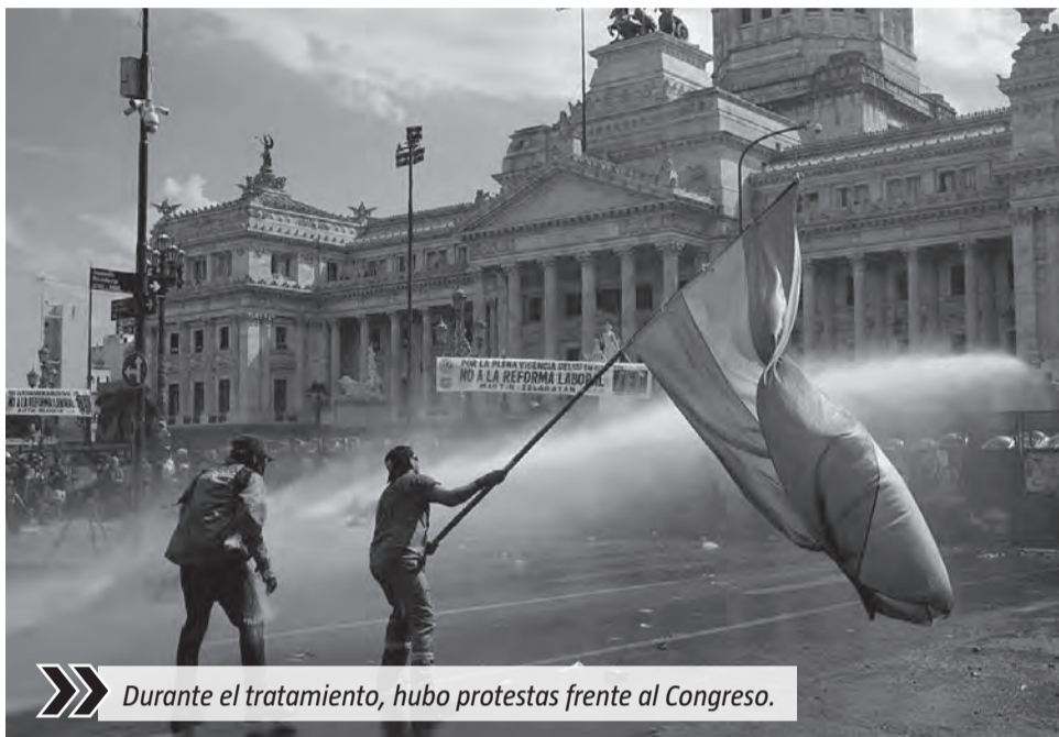
Durante el tratamiento, hubo protestas frente al Congreso.

Uno de los capítulos centrales se refiere al régimen de vacaciones. El texto habilita esquemas más flexibles para el otorgamiento de la licencia anual, permitiendo que empleadores y trabajadores acuerden su fraccionamiento en distintos períodos del año, siempre bajo determinadas condiciones. La iniciativa introduce así un criterio más adaptable en la organización de los descansos. En materia de desvinculaciones, el proyecto incorpora alternativas al sistema tradicional de indemnización por despido.