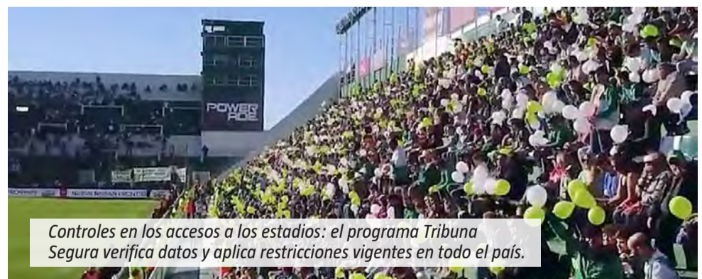
Controles en los accesos a los estadios: el programa Tribuna Segura verifica datos y aplica restricciones vigentes en todo el país.

jurisdicción, incluidos los estadios del sur del conurbano bonaerense, como los de Club Atlético Lanús y Club Atlético Banfield. La resolución aplica concretamente la sanción a 30 personas identificadas en incidentes ocurridos durante un partido organizado por la Asociación del Fútbol Argentino. Sin embargo, el alcance es general: ante episodios de