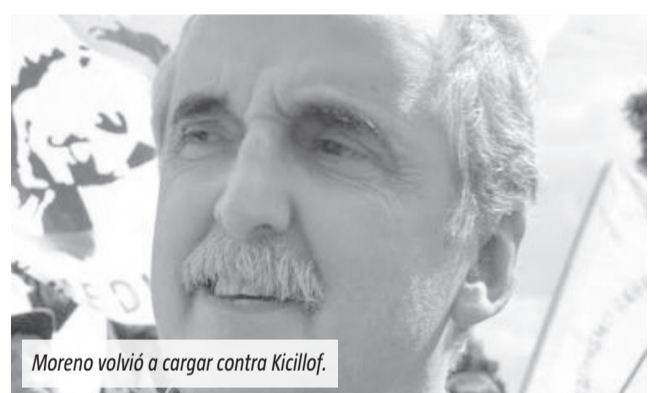
Moreno volvió a cargar contra Kicillof.

El titular de 'Principios y Valores', Guillermo Moreno, arremetió duramente contra el gobernador de la Provincia de Buenos Aires en medio de la interna del peronismo. El ex secretario de comercio aseguró que, antes de que Axel Kicillof sea presidente, prefiere que hayan dos listas. En su paso por Blender volvió a exponerse contra él y lo acusó de ser "pro chino y un anti industrialista", por lo