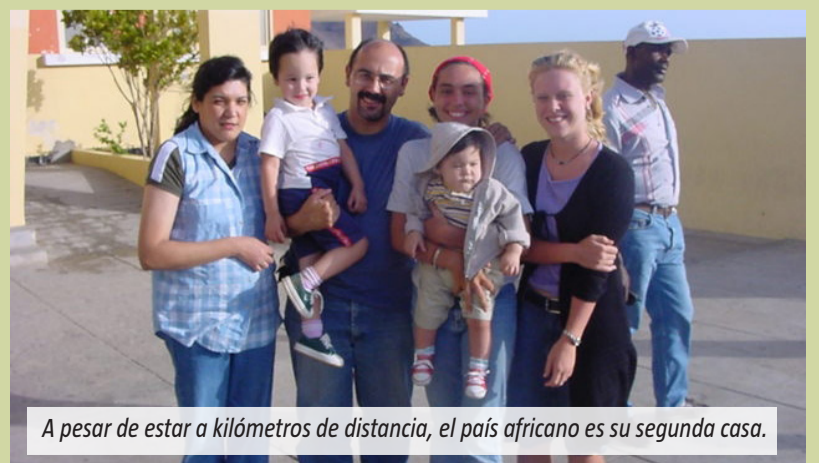
A pesar de estar a kilómetros de distancia, el país africano es su segunda casa.