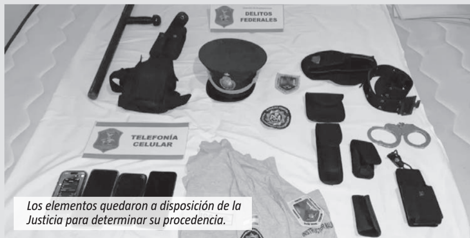
Los elementos quedaron a disposición de la Justicia para determinar su procedencia.

ordenadas por la Justicia. Los investigadores identificaron como sospechosa a una mujer que prestaba servicios en la PSA, aunque al momento del procedimiento se encontraba con licencia médica por cuestiones psiquiátricas. Con autorización del Juzgado de Garantías N°1 de Quilmes, la Policía realizó un allanamiento en una vivienda de Ezeiza vinculada a la acusada. Durante el operativo fueron secuestrados cuatro teléfonos celulares, seis relojes de alta gama, perfumes de distintas marcas, dos valijas que pertenecerían a víctimas, llaves, controles remotos de apertura