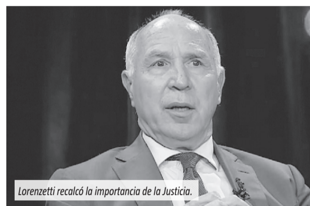
Lorenzetti recalcó la importancia de la Justicia.

El juez de la Corte Suprema Ricardo Lorenzetti se refirió a la situación de la jurisprudencia nacional y aseguró que el "Poder Judicial no tiene independencia porque no maneja su presupuesto". Además, habló sobre la necesidad de completar las vacantes disponibles en el Máximo Tribunal de Justicia "desde la diversidad de género".