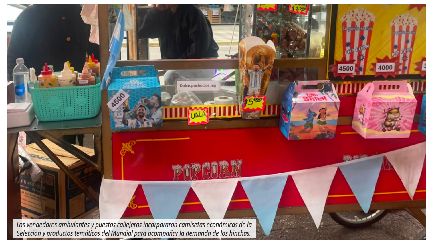
Los vendedores ambulantes y puestos callejeros incorporaron camisetas económicas de la Selección y productos temáticos del Mundial para acompañar la demanda de los hinchas.

El clima mundialista también transformó la oferta en la vía pública. En los puestos de pochoclos aparecieron cajas con la imagen de Messi, De Paul y la Copa del Mundo para atraer a los más chicos, mientras que muchos vendedores ambulantes dejaron de lado por unas semanas los habituales auriculares, cargadores, guantes o gorros para ofrecer camisetas económicas de la Selección. La indumentaria celeste y blanca pasó a ocupar el lugar de los productos que normalmente predominan en las calles comerciales de la región. En este Día del Padre, la historia refleja cómo una pasión puede convertirse en un legado familiar capaz de trascender generaciones, unir proyectos y construir un futuro compartido.