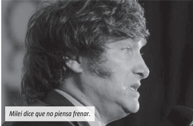
Milei dice que no piensa frenar.

El mandatario consideró que, si los argentinos "siguen abrazando las ideas de la libertad, el país crecerá como nunca antes se vio en su historia". "Ya tenemos 150.000 millones de dólares por RIGI y la economía se va a acelerar, además de las licitaciones por corredores viales. Ya empezamos a ver que el salario real le está ganando a la inflación y la inflación