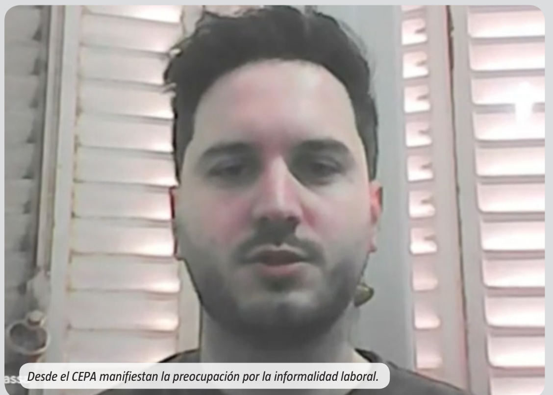
Desde el CEPA manifiestan la preocupación por la informalidad laboral.

siguiente: "Hay empleo estable pero crece la informalidad". En ese sentido, aclaró: "Hay un cambio en el mercado de trabajo. Desde que asumió Milei viene aumentando significativamente la informalidad. Por ejemplo, de trimestre a trimestre las personas que trabajan en blanco cayeron un 2 por ciento y las que lo hacen en negro aumentaron un 5 por ciento. La realidad es que el trabajo que se está creando es fundamentalmente en negro". Esto deriva en un traslado que se certifica con la chance de mucha gente de apelar a establecerse como monotributista. "Las personas que perdieron su trabajo pasaron a un régimen de monotributista o directamente trabajan en negro, y eso es una gran preocupación", completó.