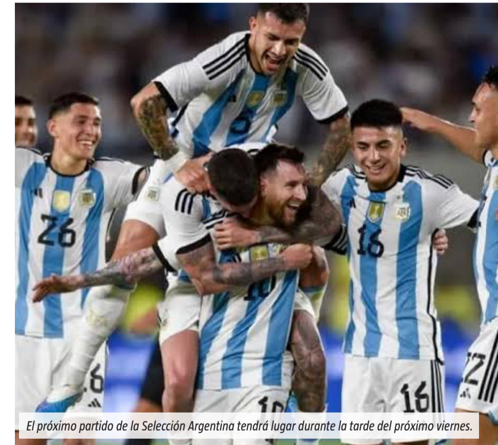
El próximo partido de la Selección Argentina tendrá lugar durante la tarde del próximo viernes.

Diversos especialistas sostienen que los grandes eventos deportivos pueden generar cambios temporales en el comportamiento de los consumidores. Aunque no existe evidencia concluyente de que ganar un Mundial provoque un crecimiento económico, sí se observan efectos vinculados al humor social y al consumo. Estudios citados por economistas muestran que los países campeones registraron en varias ocasiones mejoras en indicadores económicos. Sin embargo, investigadores y especialistas advierten que esos resultados responden a múltiples factores y no pueden atribuirse exclusivamente al fútbol. Donde sí aparecen señales más claras es en determinados rubros comerciales. El entusiasmo generado por la Selección suele impulsar la venta de productos deportivos, artículos temáticos y alimentos para reuniones familiares o con amigos. Además, especialistas en economía conductual señalan que el estado de ánimo influye en muchas decisiones de compra. Por eso, un contexto marcado por la expectativa y el entusiasmo puede traducirse en un mayor movimiento comercial, aunque sea de manera puntual y limitada en el tiempo.