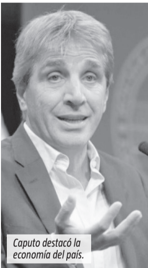
Caputo destacó la economía del país.

Por este motivo, el funcionario convocó a "perderle el miedo al pasado, porque después del esfuerzo que han hecho todos los