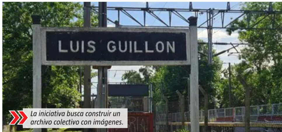
➤ La iniciativa busca construir un archivo colectivo con imágenes.

➤ Las imágenes pueden enviarse al correo electrónico luisguillon1926@gmail.com .