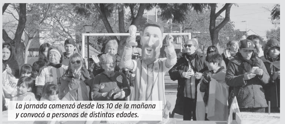
La jornada comenzó desde las 10 de la mañana y convocó a personas de distintas edades.

rosarino, que este 24 de junio cumplió 39 años. Además de las actividades realizadas en el espacio público, los organizadores visitaron la Escuela Primaria N°17, donde compartieron el festejo con los alumnos y acercaron la propuesta a los chicos. Allí hubo fotos, saludos y distintas actividades vinculadas al cumpleaños del campeón del mundo. Durante toda la mañana, la figura de Messi fue la protagonista de una celebración que combinó el fanatismo futbolero con