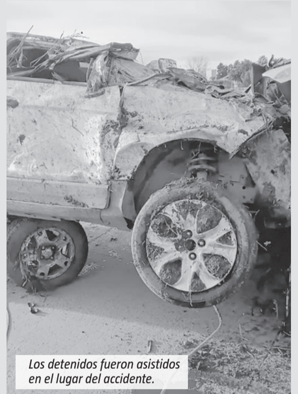
Los detenidos fueron asistidos en el lugar del accidente.

Dos hombres fueron detenidos el pasado sábado en Monte Grande tras una persecución policial que terminó cuando la camioneta en la que escapaban perdió el control, volcó y cayó a un zanjón. El operativo cerrojo fue desplegado luego de un robo en una vivienda y permitió concretar las aprehensiones. El episodio se inició a partir de un llamado al 911 por un robo en una vivienda ubicada sobre la calle Lavalle al 1000. Según informaron fuentes policiales, los delincuentes escaparon del lugar a bordo de una Ford Ecosport gris, lo que derivó en un operativo cerrojo en la zona.