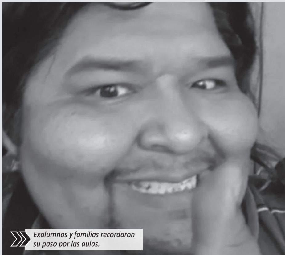
Exalumnos y familias recordaron su paso por las aulas.

También exalumnos y familias recordaron su paso por las aulas. La madre de una estudiante que lo tuvo como profesor en la Escuela Secundaria N°5 escribió: "Mi hija lo tuvo en la Media 5, una buena persona y un excelente profesor. Recuerdo cuando la iba a buscar y lo cruzaba en su moto. Un genio. Ayer quedamos sorprendidos con la noticia. Se lo va a