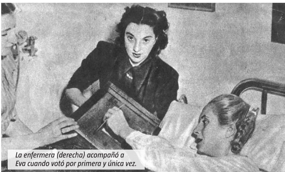
La enfermera (derecha) acompañó a Evita cuando votó por primera y única vez.