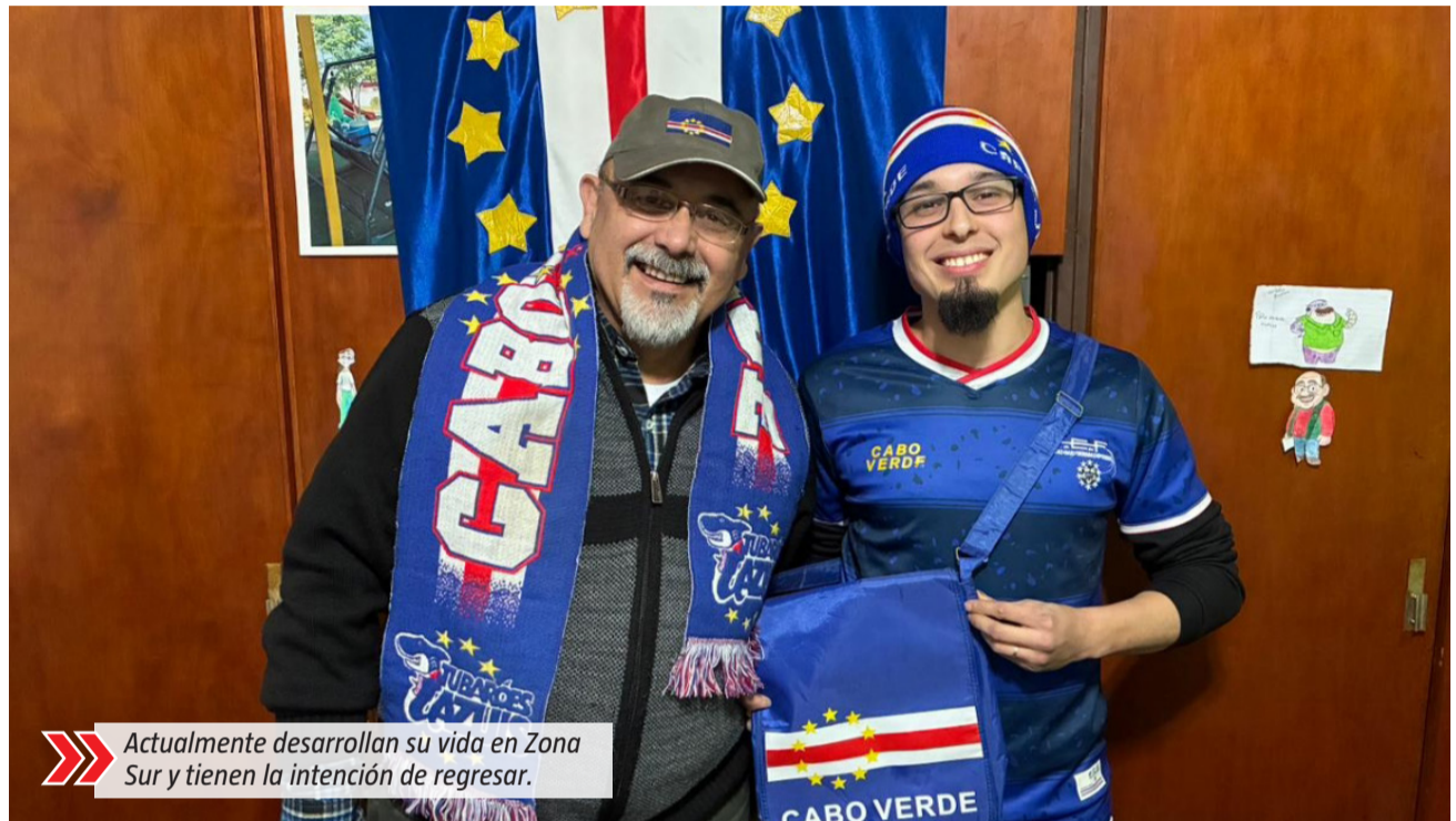
Actualmente desarrollan su vida en Zona Sur y tienen la intención de regresar.

En ese sentido, recordó que también acompañaban habitualmente a la selección nacional y presenciaron algunos encuentros históricos para el deporte caboverdiano: "Nosotros estuvimos ahí cuando Cabo Verde le ganó 3 a 1 a Ghana y hacíamos parte de la barra con un cartel grande". Según contó, el entusiasmo que transmitían desde las tribunas hizo que fueran reconocidos por dirigentes, el entrenador y jugadores locales.