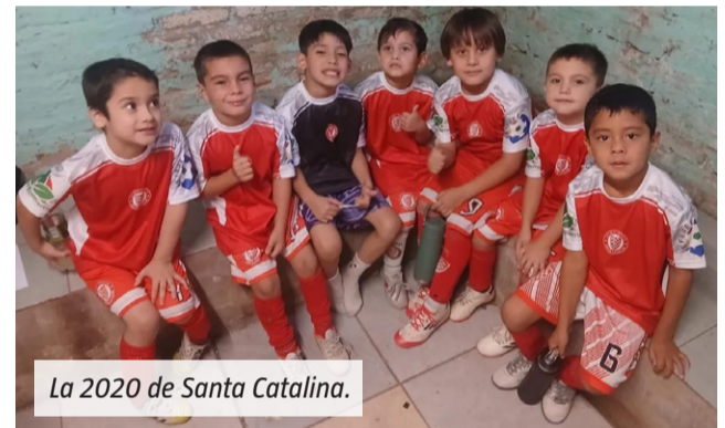
La 2020 de Santa Catalina.