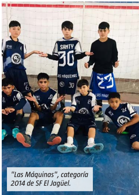
"Las Máquinas", categoría 2014 de SF El Jagüel.