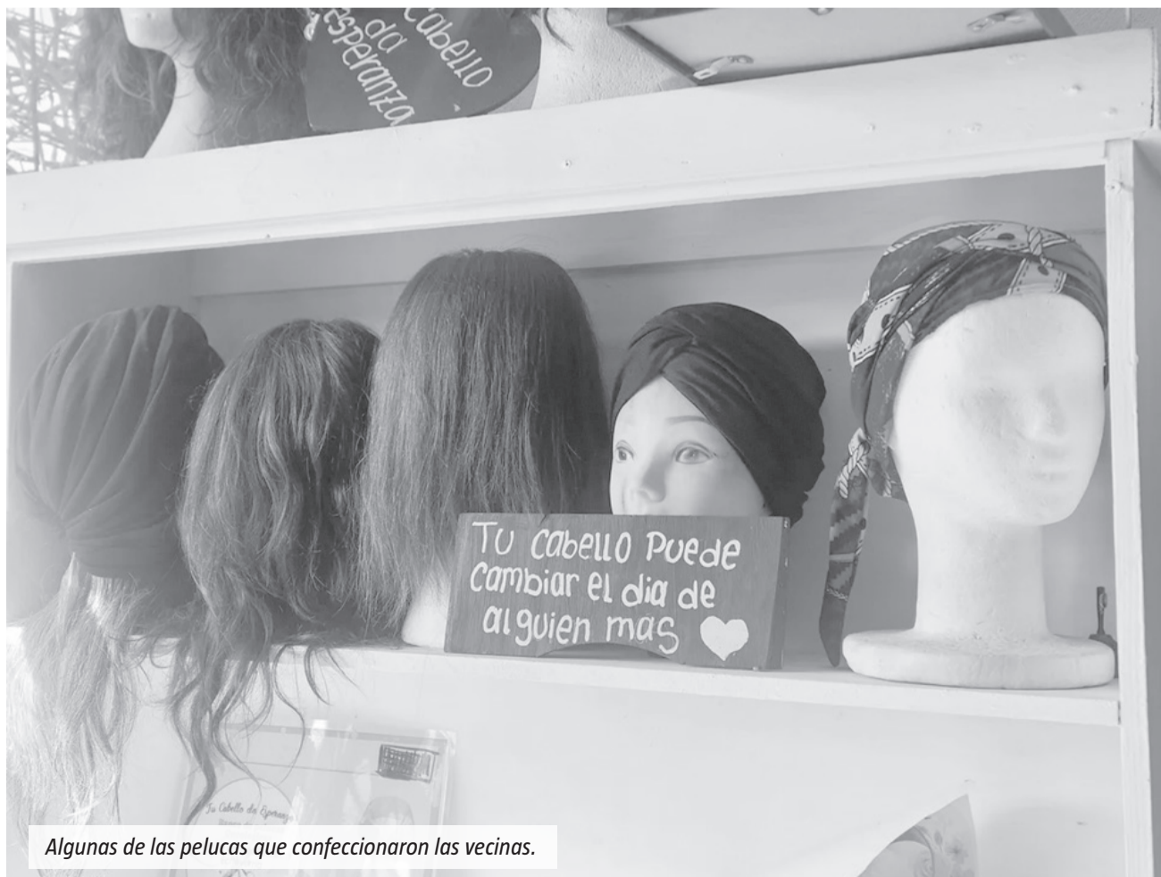
Algunas de las pelucas que confeccionaron las vecinas.

Quienes deseen sumarse pueden obtener más información a través de las redes sociales de Peluqueras Solidarias y Mechones por Sonrisas, donde también se encuentran disponibles los canales de contacto para realizar donaciones o participar como voluntarios.