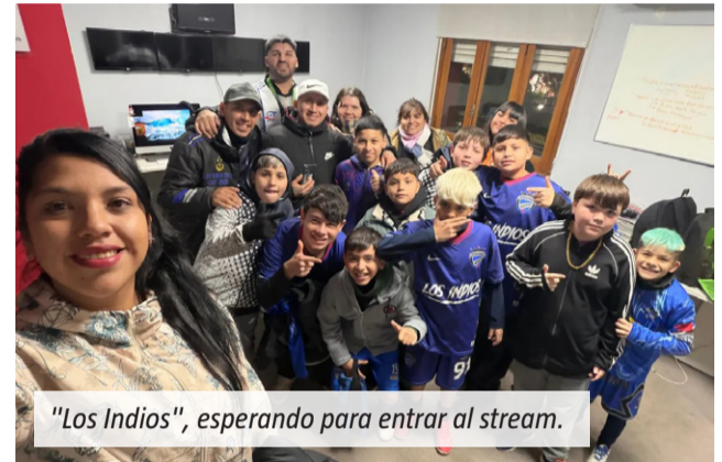
"Los Indios", esperando para entrar al stream.