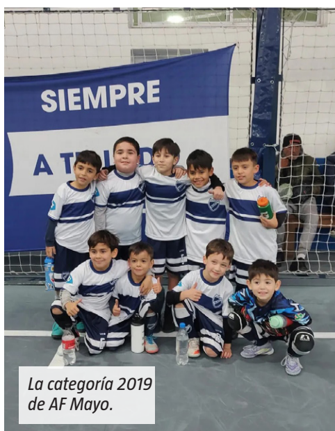
La categoría 2019 de AF Mayo.