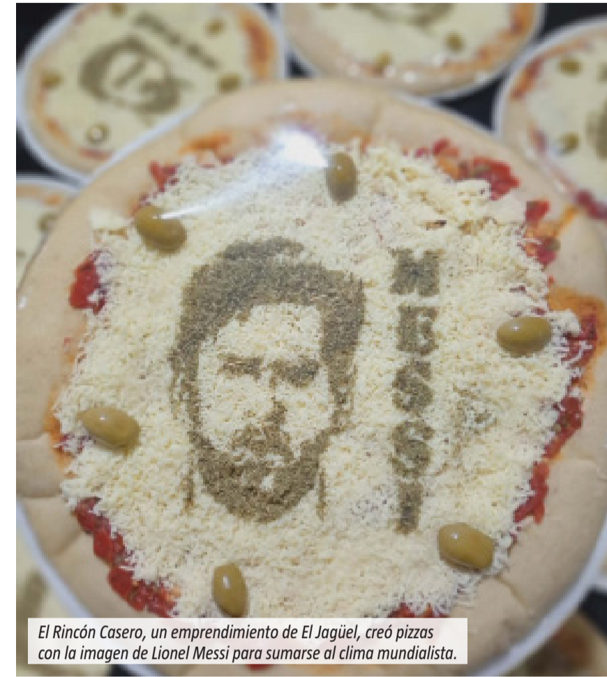
El Rincón Casero, un emprendimiento de El Jagüel, creó pizzas con la imagen de Lionel Messi para sumarse al clima mundialista.

Lo que comenzó como una idea familiar durante la previa del Mundial terminó convirtiéndose en una de las propuestas más comentadas por quienes circulan por el centro de El Jagüel. Agustina Fiurase y su madre, responsables del emprendimiento El Rincón Casero, diseñaron una pizza decorada con la imagen de Lionel Messi. La iniciativa nació mientras pensaban formas de sumarse al clima futbolero. Después de varias pruebas lograron concretar el diseño y comenzaron a ofrecerlo en su puesto callejero. La respuesta fue inmediata. Según contó la emprendedora, muchas personas se detienen para observar la pizza, sacarle fotos o comentar la ocurrencia. Incluso quienes ya conocían sus productos se acercaron nuevamente atraídos por la propuesta mundialista. El puesto funciona por las tardes cerca del cajero del Banco Provincia de El Jagüel. Allí, la pizza con la imagen del capitán argentino pasó a convertirse en el producto más solicitado durante las semanas de competencia.