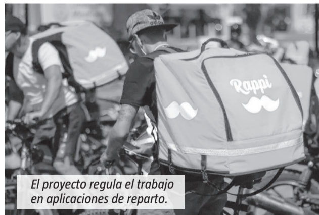
El proyecto regula el trabajo en aplicaciones de reparto.

El texto también establece la creación del Registro de Trabajo Mediante Plataformas Digitales. La inscripción será obligatoria para las empresas, que deberán informar los da-