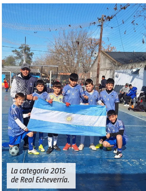
La categoría 2015 de Real Echeverría.