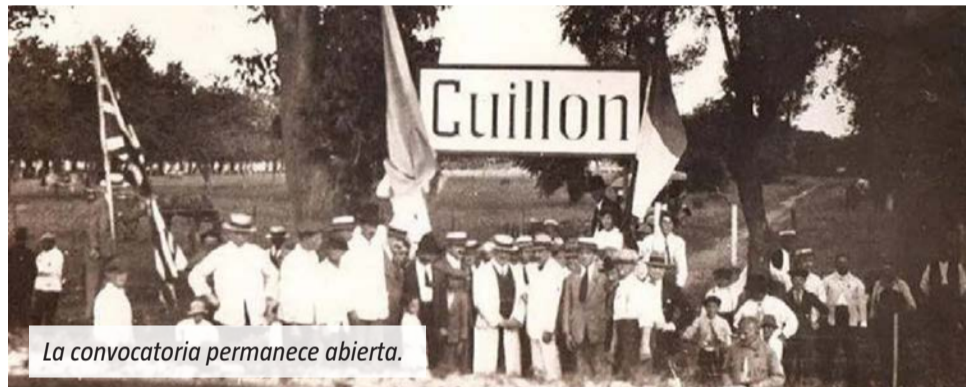
La convocatoria permanece abierta.

luisguillon1926@gmail.com . La convocatoria permanece abierta para todos aquellos que deseen aportar una parte de la historia de la localidad y ser parte de los festejos por sus primeros 100 años.