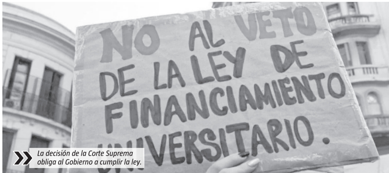
La decisión de la Corte Suprema obliga al Gobierno a cumplir la ley.

Ese entendimiento prevé un incremento del 24,33% en la masa salarial, distribuido en un 21,33% durante junio